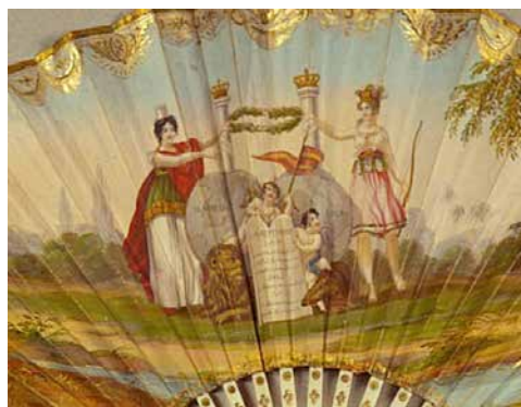
Fig. 11. Detalle del abanico España y América defienden la Constitución de 1812 , h. 1820, papel iluminado, pintado y dorado, alt. 21,6 cm, Museo de historia de Madrid (inv. 2613)