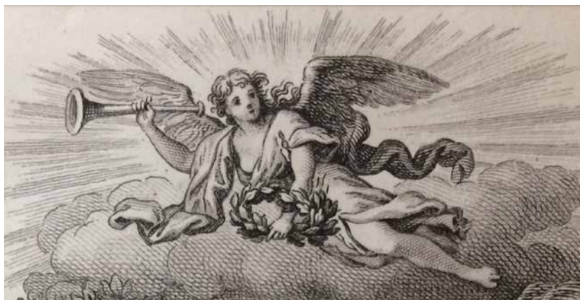
Fig. 16. Detalle de las ilustraciones de la Constitución política de la monarquía española, promulgada en Cádiz a 19 de marzo de 1812, grabada y dedicada a las Cortes por Don José María de Santiago, 1822

En cuanto a emblemas procedentes de la Antigüedad grecolatina, distintos elementos heredados se repiten continuamente: las coronas de laurel, las palmas de la victoria, la cornucopia... Otros tantos emblemas a menudo sostenidos por unas de las figuras alegóricas aladas que pueblan las estampas analizadas: seres tocando el clarín para anunciar un futuro glorioso, trayendo a los actores del liberalismo símbolos de su triunfo. Nos proporcionan ejemplos paradigmáticos de su importancia el abanico de la Alegoría del restablecimiento constitucional (Fig. 9) así como la portada de Constitución, en la edición ilustrada de José María de Santiago (Fig. 16).