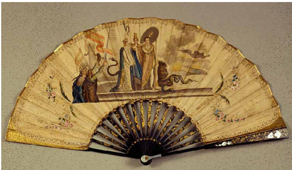
Fig. 5. Abanico Alegoría de la jura de la Constitución por Fernando VII , h. 1820, país de papel grabado, iluminado, pintado y dorado, alt. 21,5 cm, Museo de historia de Madrid (inv. 2611)