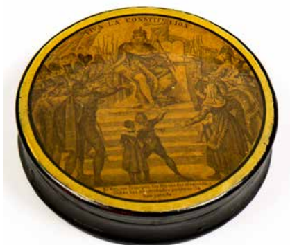
Fig. 12. Tabaquera Viva la Constitución , Museo de historia de Madrid