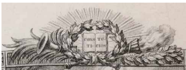
Fig. 17. Parte superior de todas las páginas ilustradas de la edición de la Constitución de 1822

Ahora bien, como afirma Carlos Reyero, “[f]ue en Francia [...] donde ese repertorio se consolidó de forma más compleja y eficiente. La razón revolucionaria impuso la codificación visual de unos valores abstractos, universalmente válidos, que habían de terminar por ser asumidos familiarmente, a través de una sencilla lectura” (2008: 420). La Francia revolucionaria es la que actualiza, difunde y populariza los referentes visuales de la Antigüedad clásica, haciéndolos indisociables del repertorio propagandístico de la época: detrás de las alegorías de tradición greco-romana, por lo tanto, es de nuevo la impronta francesa la que resulta ser como principal influencia. Cabe interrogar, entonces, la procedencia de otros emblemas. El gallo, que divisamos en el abanico Escena alegórica de la Constitución de 1812 (Fig. 15), ¿equivale al símbolo de la esperanza, en la tradición cristiana, o al símbolo político de la idea republicana? (Orobon, 2007). La omnipresencia de los rayos de luz, en particular para poner de realce el texto constitucional (Fig. 17 y 18), ¿se corresponde con la iluminación divina, o con el “mito solar de la Revolución mediante la metáfora de la luz vencedora frente a las tinieblas”? (Roca Vernet, 2002: 205) 13 . Si, a veces, el sincretismo simbólico es evidente, la filiación iconográfica con Francia se afirma ampliamente, aunque sea de manera casi siempre indirecta.