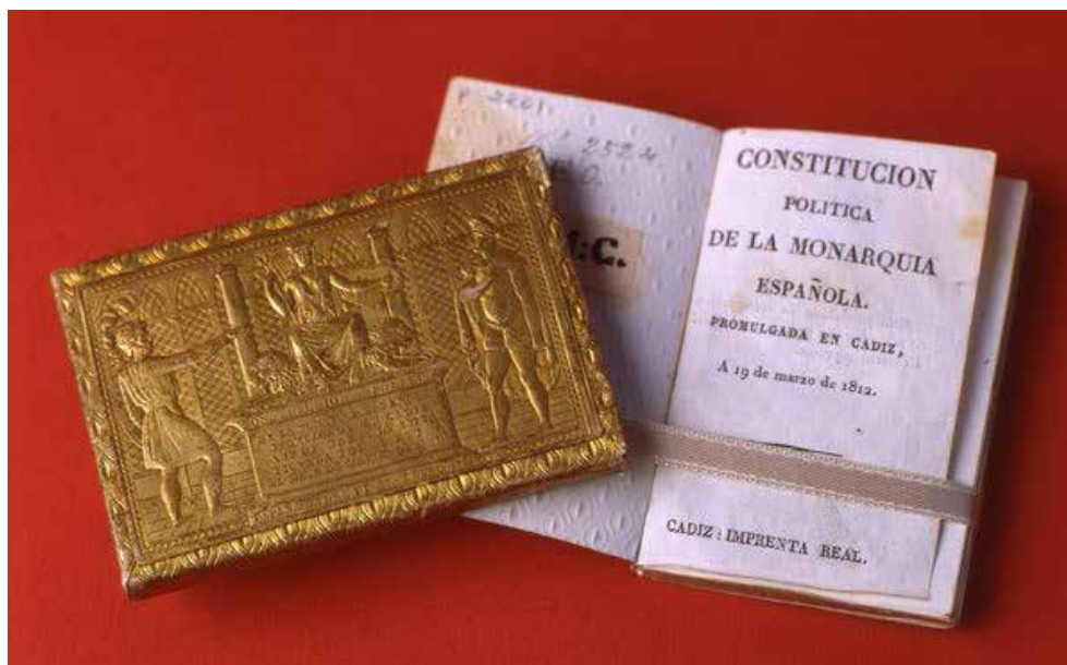
Fig. 1. Estuche de cartón forrado de papel, con revestimiento dorado y gofrado, para guardar la Constitución política de la monarquía española , 1820, 5,9 x 8,5 cm, Museo de historia de Madrid (inv. 2211)

En esta ambición de definición de un “ fiat constitucional ” (Fernández Sebastián, 2022: 520), la pregunta esencial que cabe hacerse es la de los hitos seleccionados. Analicemos para ello una edición de la Constitución conservada en el Museo de historia de Madrid, y sobre todo el estuche que permitía a su dueño guardar su ejemplar (Fig. 1).