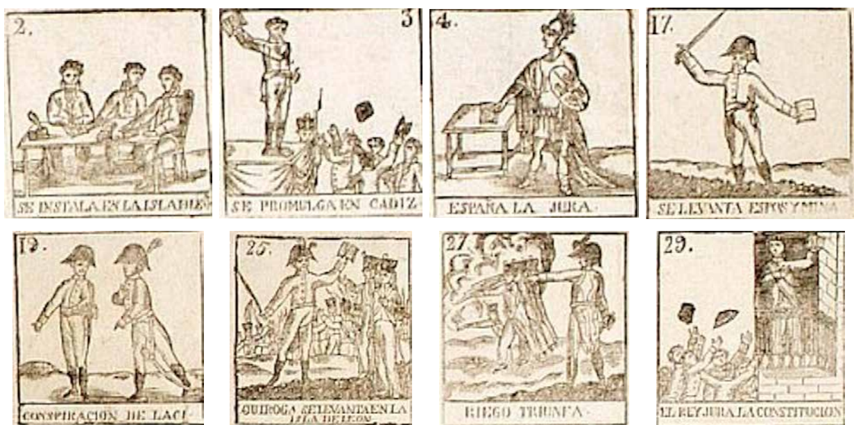
Fig. 3. Viñetas de la Aleluya sobre la Constitución , h. 1820, 42 x 29,4 cm, Museo de historia de Madrid (inv. 4949)