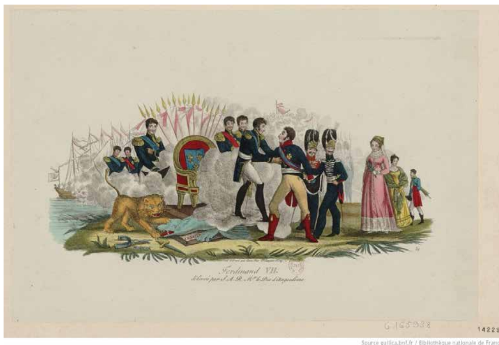
Fig. 21. Ferdinand VII délivré par le Duc d'Angoulême , estampa, Bibliothèque nationale de France