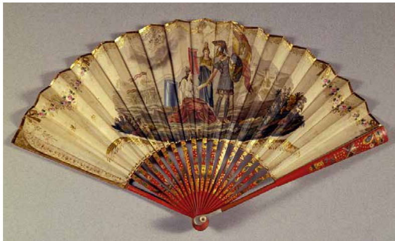
Fig. 14. Abanico Alegoría de las libertades constitucionales , h. 1820, papel grabado, iluminado, pintado y dorado, alt. 20 cm, Museo de historia de Madrid (inv. 2608).

En su empresa de legitimación a partir de los orígenes, los liberales españoles se inscriben en una segunda tradición, además de la cristiana: la Antigüedad clásica. Valerse de una iconografía pre-existente presenta en efecto por lo menos dos ventajas. La primera es que garantiza la accesibilidad del mensaje, por recurrir a códigos visuales tan conocidos que no necesitan descifrarse. Es así como la aleluya ya mencionada, vehículo propagandístico popular por excelencia, representa a España a través de figuras vestidas a la manera antigua (en particular en las viñetas 4 y 31). La segunda ventaja es que permitía “situar la alegoría por encima de las circunstancias del tiempo, en un mundo olímpico que no estaba ligado a los intereses materiales del momento” (Reyero, 2010: 155). El liberalismo quiere convertirse en atemporal, universal, icónico, y recurrir a filiaciones clásicas es una manera idónea para conseguirlo. La omnipresencia de figuras –masculinas, a veces, pero la mayoría del tiempo femeninas– vestidas con togas grecorromanas resulta así evidente en todas las imágenes estudiadas, pero es particularmente marcada en el siguiente abanico, Alegoría de las libertades constitucionales (Fig. 14), donde las figuras de España, del ejército liberal y de la Constitución restaurada visten todas a la manera clásica (Tuda y Pastor Cerezo, 1995: 150-151).