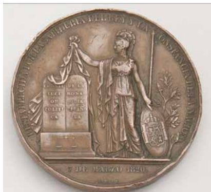
Fig. 10. Reverso de la medalla Restablecimiento de la Constitución , 1820, grabado por Jean-Jacques Barré, bronce, diám. 50 mm, Museo nacional del romanticismo (inv. CE6707)