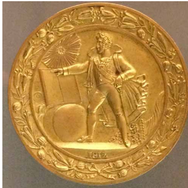
Fig. 7. Caja con la imagen de Fernando VII, bronce, Museo de historia de Madrid (inv. 2615)

En la litografía conservada en el Establecimiento del depósito hidrográfico de Madrid (Fig. 8), la figura de pie y en movimiento, combativa y determinada, deja paso a una figura a la que nos acercamos para constatar su quietud e impasibilidad, señal “de una realidad que permanece más allá de los avatares de las circunstancias” (Reyero, 2010: 148). Y el libro abierto se ve sustituido por una estatua alegórica, en cuyo pedestal se puede leer la mención “Constitución”. La gestualidad aquí cambia: el brazo de Fernando no está tendido ni su índice dirigido hacia la Constitución. Pero el acto de juramento se plasma en otros recursos: la mirada del rey clavada en la de la estatua, el “Yo juro” inscrito en el pedestal y la mano que descansa en lo que quizás pueda ser un ejemplar de la Constitución.