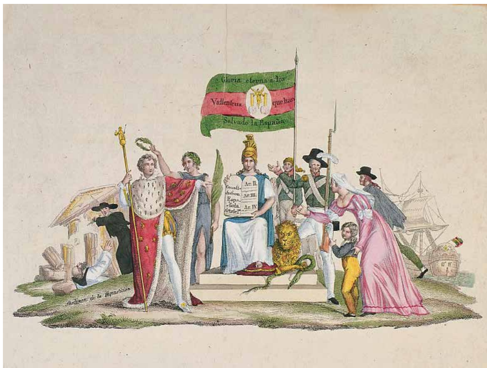
Fig. 6. Alegoría de la jura de la Constitución por Fernando VII, Rey de España , h. 1820, cobre de talla dulce, 19,4 x 25 cm, Museo de historia de Madrid (inv. 2129)