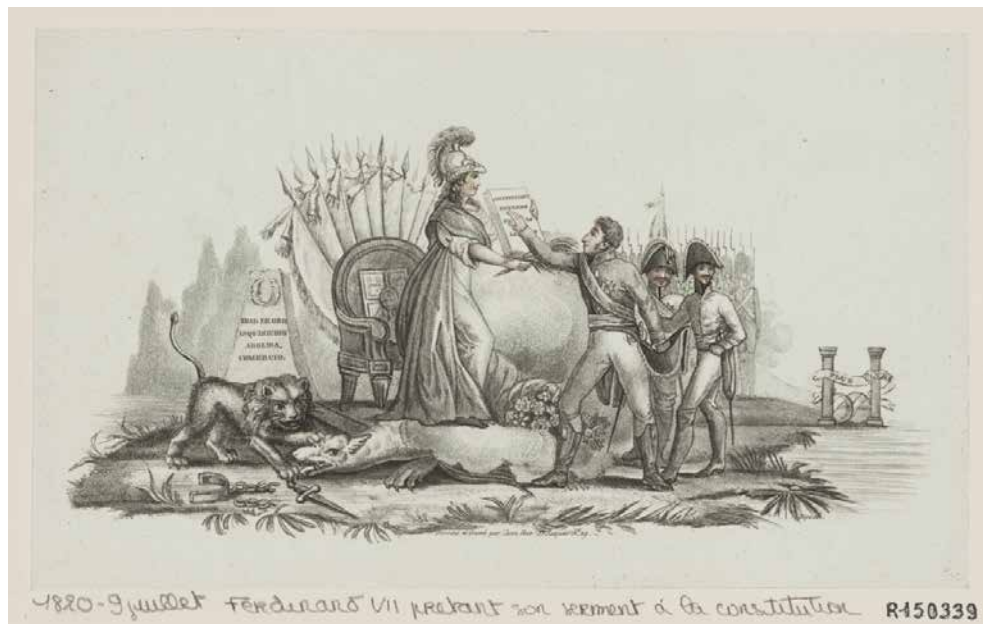
Fig. 20. Ferdinand VII prêtant son serment à la Constitution , estampa, c. 1820, Cabinet des estampes (QC2 R-150.339)

y la familia real), se puede retomar la misma composición, con los mismos emblemas y las mismas posturas. Semejante reapropiación es señal de que, aunque el régimen de los años 1820-1823 no pudo con todos los obstáculos con los que se enfrentó, la propaganda liberal había sabido echar raíces en las mentes de los españoles.