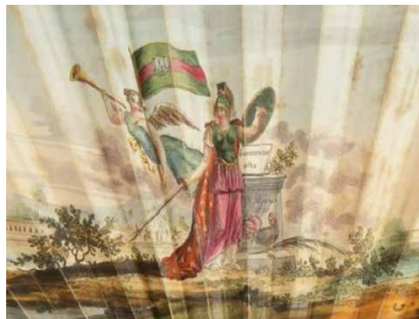
Fig. 15. Abanico Escena alegórica de la Constitución de 1812 , h. 1820, papel con aguafuerte pintado a la acuarela, altura del país 14 cm, Museo nacional del romanticismo (inv. CE2473). Detalle

Entre las alegorías que se convocan preferentemente, podemos citar la figura de la Justicia. Sin embargo, la que invade las imágenes liberales de la época del Trienio, como personificación de la Constitución, es Minerva. Además de aparecer en varios ejemplos ya presentados (en particular Fig. 5, 6, 10 y 14), domina muchas de las estampas representando el restablecimiento constitucional, como en este un abanico conservado en el Museo nacional del romanticismo (Fig. 15):