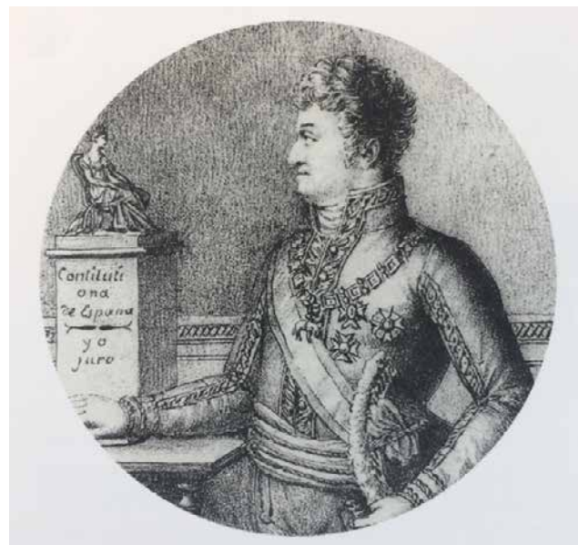
Fig. 8. Fernando VII jurando la Constitución , litografía, 104 x 73 mm, Establecimiento litográfico del depósito hidrográfico de Madrid

En la litografía conservada en el Establecimiento del depósito hidrográfico de Madrid (Fig. 8), la figura de pie y en movimiento, combativa y determinada, deja paso a una figura a la que nos acercamos para constatar su quietud e impasibilidad, señal “de una realidad que permanece más allá de los avatares de las circunstancias” (Reyero, 2010: 148). Y el libro abierto se ve sustituido por una estatua alegórica, en cuyo pedestal se puede leer la mención “Constitución”. La gestualidad aquí cambia: el brazo de Fernando no está tendido ni su índice dirigido hacia la Constitución. Pero el acto de juramento se plasma en otros recursos: la mirada del rey clavada en la de la estatua, el “Yo juro” inscrito en el pedestal y la mano que descansa en lo que quizás pueda ser un ejemplar de la Constitución.