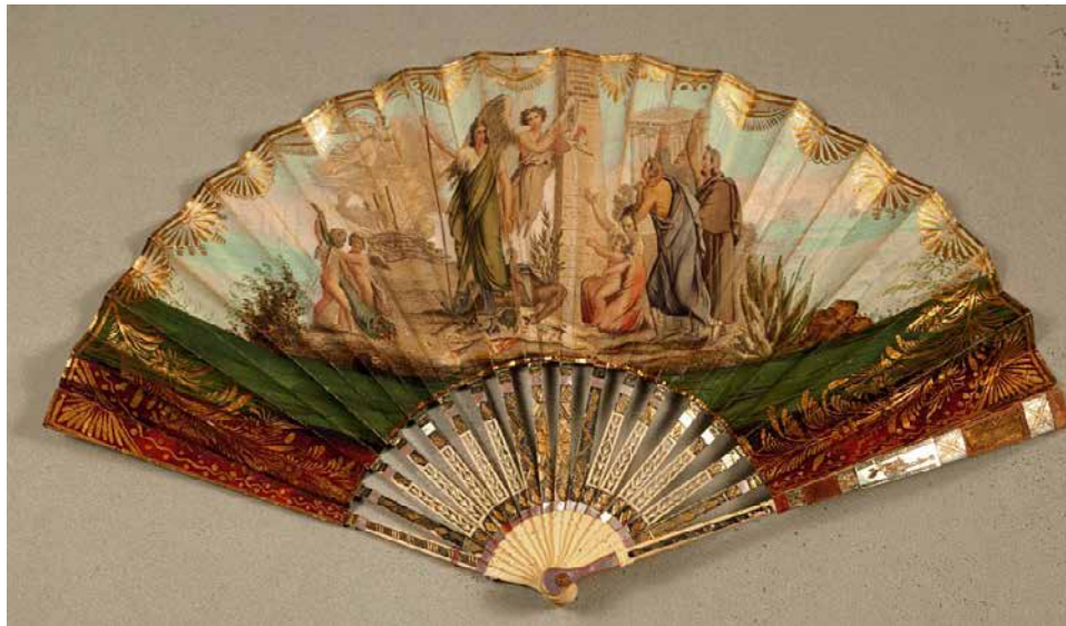
Fig. 9. Abanico Alegoría del restablecimiento constitucional , h. 1820, país de papel litografiado, iluminado, pintado y dorado, alt. 21,8 cm, Museo de historia de Madrid (inv. 2609)

La distancia referencial que adoptan las últimas imágenes evocadas respecto al evento conmemorado nos permite incluso acercarnos a otras ilustraciones para ver si, aunque sea de manera indirecta, radican en el mismo acto fundador. Existe en particular una estampa de sesgo exclusivamente alegórico, en la que no solo desaparecen el salón de Cortes y los diputados, sino también el mismo rey, pero que aun así parece referirse a la misma génesis: el abanico que el Museo de historia de Madrid conservado bajo el título Alegoría del restablecimiento constitucional (Fig. 9).