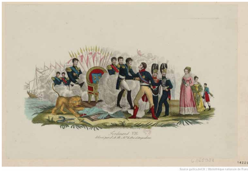
Fig. 21. Ferdinand VII délivré par le Duc d'Angoulême , estampa