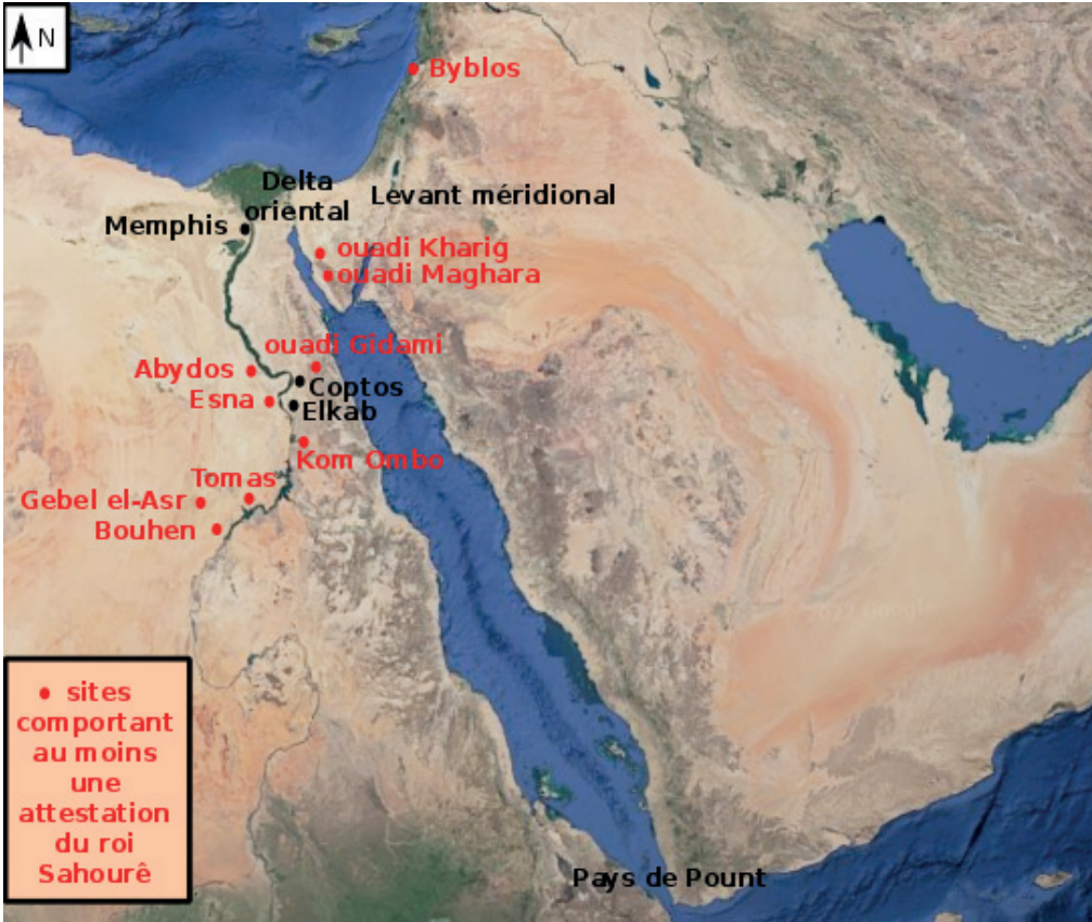
1. Sites et principales régions d'intervention du roi Sahourê (élaboration : E. Martinet).

scènes de son complexe funéraire représentant le retour de navires de haute mer avec des hommes et femmes asiatiques à bord et revenant probablement de Byblos ( fig. 1 ) 75 , ainsi qu'un fragment sur lequel sont représentés des ours bruns rapportés de Syrie 76 . De surcroît, un sceau-cylindre en terre cuite évidé, trouvé dans le temple de Ba'alat Gebal à Byblos, a été attribué sans certitude au roi Sahourê 77 .