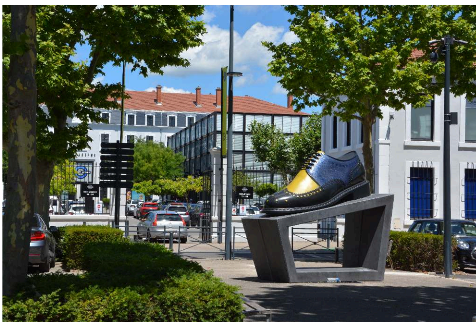
Figure 2. Chaussure monumentale devant l'entrée de Marques Avenue (en arrière-plan)