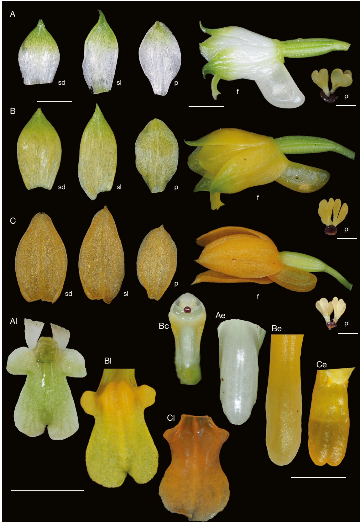
FIG. 3. — Comparaison entre Calanthe ventrilabrum (A), C. x villegentei nothosp. nov. (B) et C. balansae (C). Abréviations: sd, sépale dorsal ; sl, sépale latéral ; p, pétale ; f, fleur (profil) ; pl, pollinarium, l, labelle, e, éperon, c, colonne. Échelles: sd, sl, p, f, l, e, c, 5 mm ; pl, 1 mm.