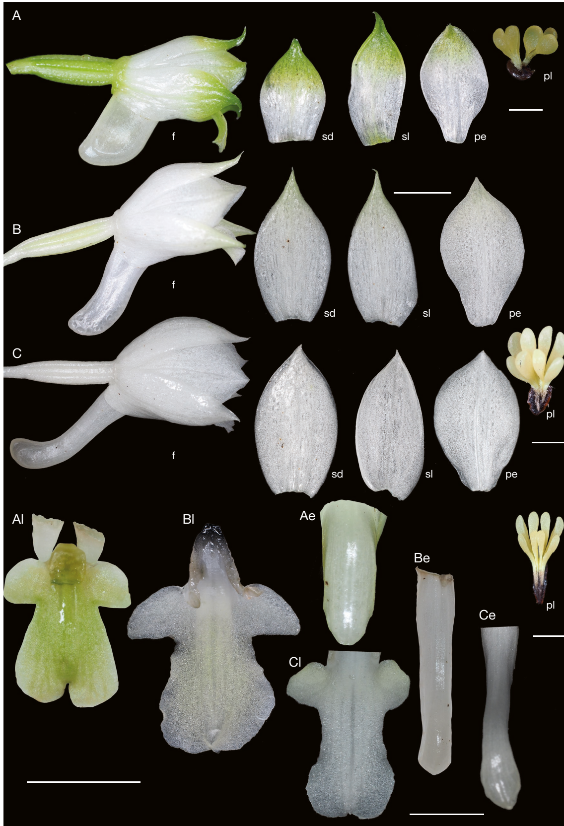
FIG. 1. — Comparaison entre Calanthe balansae (A), C. x oreadum (B) et C. hololeuca (C). Abréviations: sd, sépale dorsal ; sl, sépale latéral ; p, pétale ; f, fleur (profil) ; pl, pollinarium, l, labelle, e, éperon. Échelles: sd, sl, p, f, l, e, 5 mm ; pl, 1 mm.