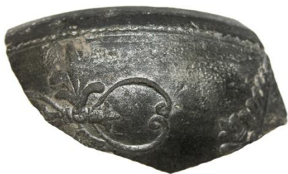
Figura 6. Frammento di coppa tipo Sarius rinvenuta in via Retratto, ad Adria (RO).