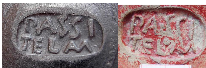
Figura 14. A sinistra, il fondo di coppetta con rivestimento nero bollata da Passius Telamo proveniente da Adria e, a destra, la versione con rivestimento rosso del Magdalensberg.

Altri dati per approfondire la comprensione dell'esistenza di manufatti con argille grigie provengono dai materiali firmati da Passius Telamo , figulo padano che bolla sia esemplari neri, come nel caso del fondo di Adria (RO), località dalla quale provengono altre due coppe con analoga finitura ma prive di bollo, (Mantovani 2015: tab. 5 n. 94), sia esemplari rossi, come al Magdalensberg (Schindler and Scheffenegger 1977: tav. 109) e in numerosi altri siti della Pianura Padana (OCK 1380) (fig. 14).