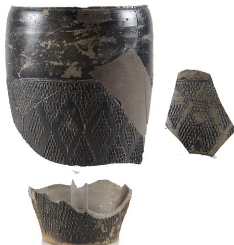
Figura 4. Due esemplari di bicchiere tipo Aco della stipe del Montirone-Abano Terme (PD).