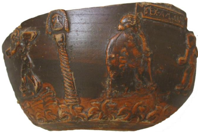
Figura 12. Coppa decorata a matrice conservata al Metropolitan Museum di New York, firmata SEX AVLIENI.