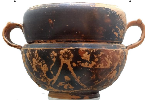
Figura 10. Coppa tipo Sarius di Spinimbecco.