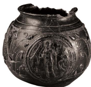
Figura 15. Bicchiere decorato a matrice fabbricato nell'atelier di Thonon-les-Bains, nei pressi del lago di Lemano, in Francia. Da Berman 2015: 249, 251 fig. 9.

Sempre in terra sigillata gallica va citato l'esemplare di bicchiere decorato a matrice fabbricato nell'atelier di Thonon-les-Bains , nei pressi del lago di Lemano, in Francia (Berman 2015: 249, 251 fig. 9) (fig. 15).