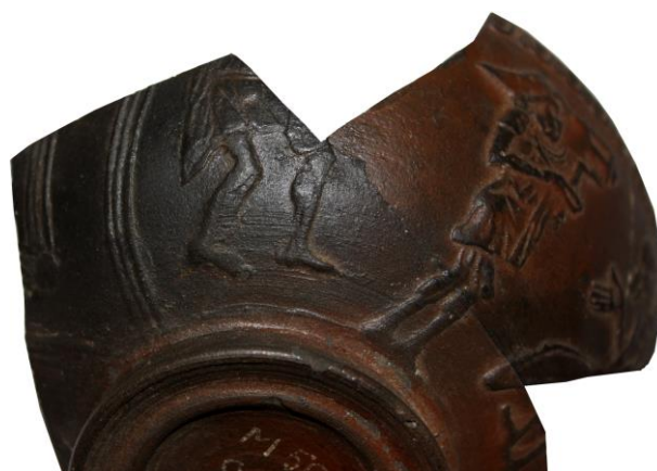
Figura 11. Coppa con scena di commedia del Magdalensberg.