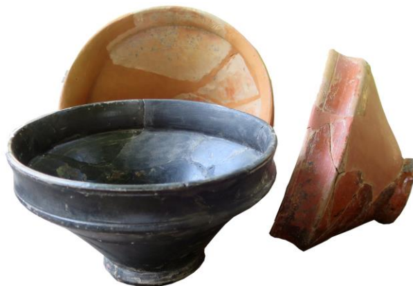
Figura 1. Coppette in terra sigillata liscia del Magdalensberg.

Vari sono i manufatti in terra sigillata che presentano superfici nere o brunastre. Un caso abbastanza emblematico, e utile all'introduzione del presente lavoro, è rappresentato da due coppette in terra sigillata liscia rinvenute nel sito del Magdalensberg, in un primo momento edite come ceramica a vernice nera 1 e successivamente attribuite alla produzione di terra sigillata, definendo il colore della vernice come esito di combustione (Schindler 1986: 368). Una terza coppetta dell'emporio norico con bollo ARRET pubblicata inizialmente come vernice nera (Schindler 1967: tav. 6 n. 20) è stata edita una seconda volta come terra sigillata bruciata (Schindler 1986) (fig. 1).