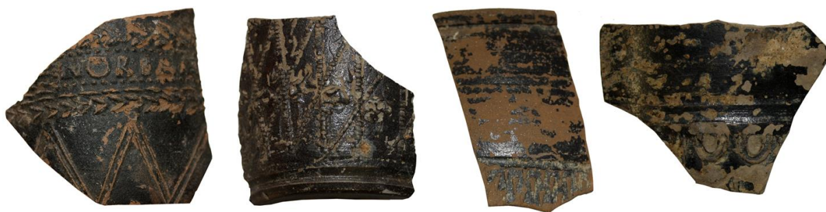
Figura 2. Quattro esemplari di bicchieri tipo Aco del Magdalensberg con rivestimento nero.