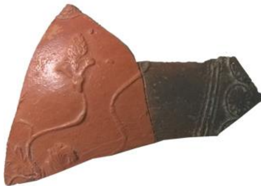
Figura 9. Due frammenti combacianti pertinenti allo stesso esemplare di coppa tipo Sarius, da Verona.

Tuttavia, l'esiguità dei frammenti non permette mai di giungere ad una definizione certa del manufatto, come ci dimostrano un esemplare veronese rinvenuto in via Redentore 9 (Stuani 2017: p. 113, Tav 22.6) in cui frammenti combacianti presentano colorazioni estremamente diverse, esito di differenti luoghi di giacitura: il piccolo frammento di color nero, rinvenuto in una strato diverso da quello che conteneva i due frammenti di color rosso, è stato certamente esposto ad un fuoco secondario. Come avremmo interpretato il singolo frammento di colore nero, privo del suo corrispettivo rosso (fig. 9)?