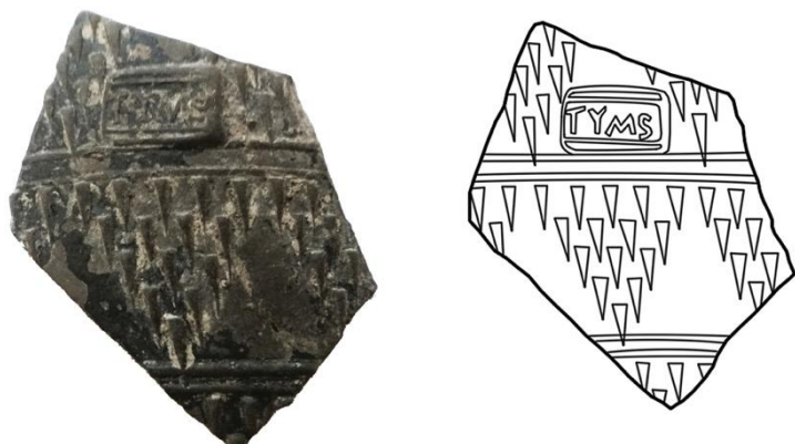
Figura 3. Frammento di bicchiere tipo Aco firmato TYMS, da Krk.