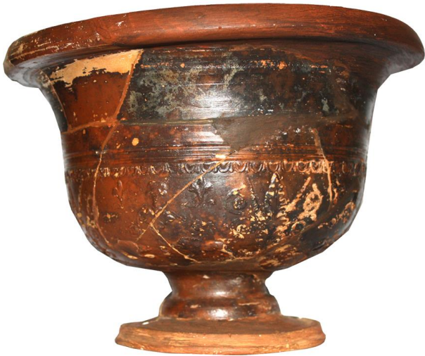
Figura 13. Grande calice con scena di caccia del Magdalensberg, firmato da Clemens.