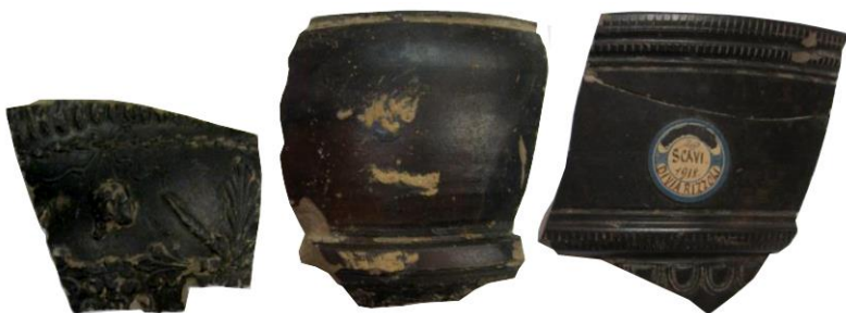
Figura 7. Frammenti di orli e pareti di coppe tipo Sarius e calice Consp. R 4 da via Rizzoli, Bologna.

Bologna, via Rizzoli (Fava 1962, p. 57, n. 380; Corti 2016, p. 90) (fig. 7);