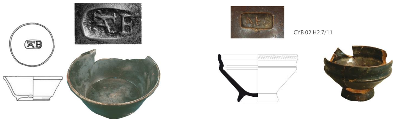
Figura 16. Consp. 14 firmata da Ateius (OCK. 269) di produzione lionese rinvenuta ad Avenche (da Blanc and Meylan Krause 1997: fig.10b, no cat. 1). A destra: Consp. 22 firmata da Ateius (OCK 269) di produzione lionese rinvenuta a Lione Pseudo-Sanctuaire de Cybèle (da Desbat 2008:527–533).

Spostandoci oltralpe, verso il versante occidentale, menzioniamo poi l'esemplare di coppa Consp. 14 di produzione lionese rinvenuta ad Avenches e firmata da Ateius (OCK 269), considerata intenzionalmente nera (Blanc and Meylan Krause 1997: fig.10b, no cat. 1) (fig. 16), ed un secondo esemplare di Consp. 22 nera, sempre bollata ATEI, dal Pseudo-sanctuaire de Cybèle ( Desbat 2008:527–533) (fig. 16). Secondo Armand Desbat questi pezzi, rinvenuti al di fuori dei territori delle officine, sono da considerarsi come manufatti di seconda scelta ugualmente commercializzate. 20 Si tratterebbe, in questo specifico caso, di un ulteriore gruppo rispetto a quelli sopra enunciati, ma per questi materiali, ancor più che per quelli analizzati fino ad ora, il discrimine tra bellezza, difetto, prima e seconda scelta, è ancora più labile.