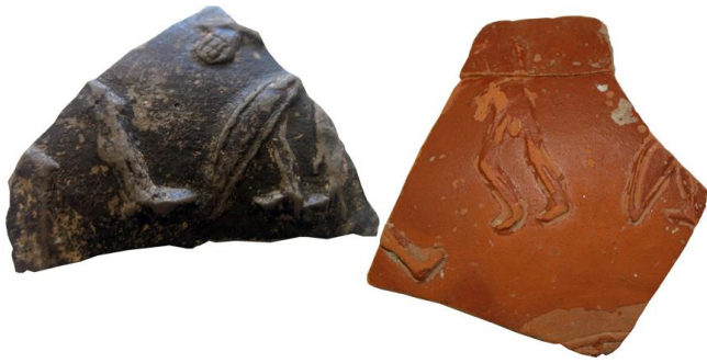
Figura 8. A sinistra, un frammento di coppa decorata a matrice con rivestimento nero dal sito del Fréjus (Rivet and Saulnier in press), mentre a destra un frammento con rivestimento rosso e analoga scena figurata dal Magdalensberg.

Tali manufatti sono stati prodotti volutamente con queste caratteristiche e, così, l'identificazione dei pezzi sembrerebbe tutto sommato semplice.