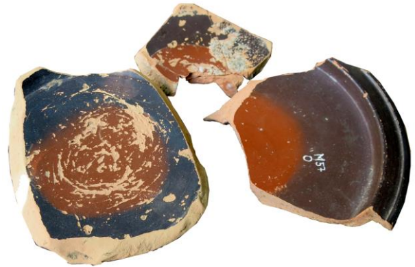
Figura 17. Alcuni esempi di dischi di impilamento su fondi di ceramica a vernice nera rinvenuta al Magdalensberg.

Il fenomeno è documentato anche nelle stoviglie a vernice nera rinvenute a Pompei (McKenzie Clark 2013: 16, PC 20), ad Arezzo (Morel 1963: 56), nella produzione calena terminale (Pedroni 1990: 170) e nella produzione di Rhode, in Spagna occidentale (Principal and Ribera i Lacomba 2013: 132). L'abitudine, così discretamente diffusa, non può essere esclusivamente imputabile ad una realizzazione più cursoria dei manufatti, ma la presenza di un elemento circolare di colore rosso