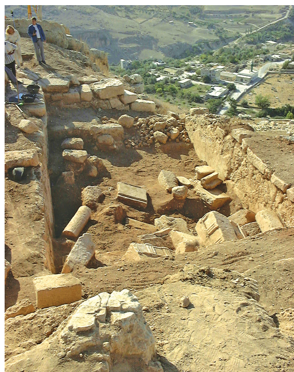
Fig. 25 - Le bassin de la falaise en cours de dégagement.

lors de son retranchement outre Jourdain – devait avoir une autre image que celle que nous connaissons aujourd'hui. Elle semble, d'autre part, repousser les limites de l'enclos du domaine au-delà du sommet de la falaise abritant les grottes.