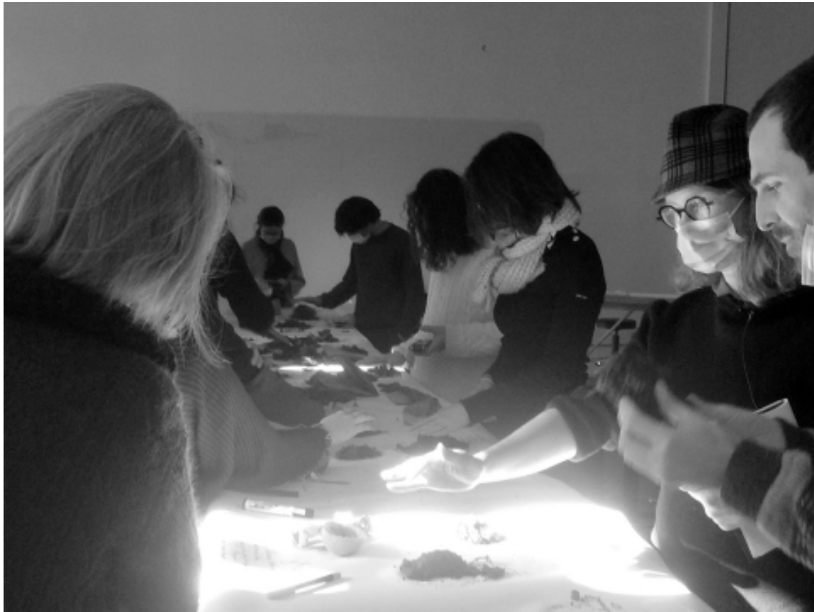
Figure 5 : Atelier Pétrichor à l'université Grenoble-Alpes en janvier 2022.

l'histoire des rapports urbains aux sols, ce sont les participants qui connaissaient le mieux l'histoire du site et permettaient de réaliser une enquête en lien avec les problématiques locales.