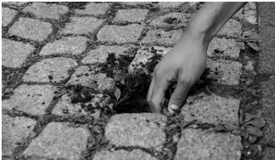
Figure 4 : Collecte de sol, Montreuil, résidence au Centre Tignous d'art contemporain.

olfactive des sols par l'écrit réintroduit ici la dimension narrative et spéculative, motrice de notre recherche à la genèse du projet. Nous invitons les participants à faire appel à la fiction ainsi qu'à leurs souvenirs personnels afin de se rapprocher le plus finement possible l'odeur du sol, alors que souvent les mots viennent à manquer pour décrire une expérience olfactive.