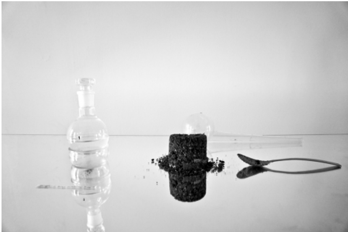
Figure : Premier hydrolat de sol.

par un principe d'hydrodistillation, avant de mettre en mots et en couleurs les odeurs perçues. L'intention n'est pas de reproduire l'odeur du pétrichor, mais de se rapprocher de manière sensible des sols, de leurs genèses et de leurs devenirs.