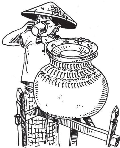
Jean-Luc Didelot, Sans titre , 2021.

« Dans toute sa simplicité, adressée à tous, l'offrande d'eau se situe par-delà l'espace communautaire et au-delà du temps rituel. »