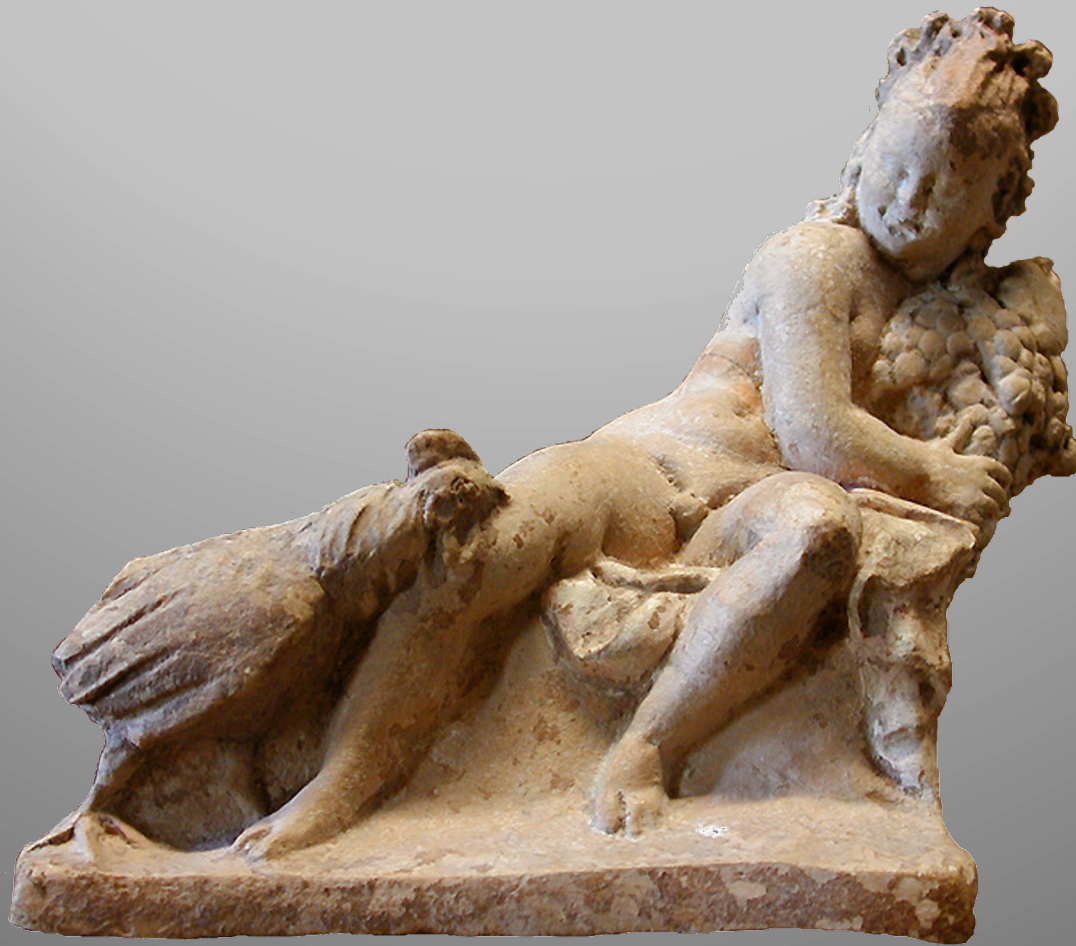
Enfant soustrayant des grappes de raisin à un coq (H. 10,3 cm, L. 11,5 cm ; Louvre Myr 310. Myrina, II e s. av. n.è.)