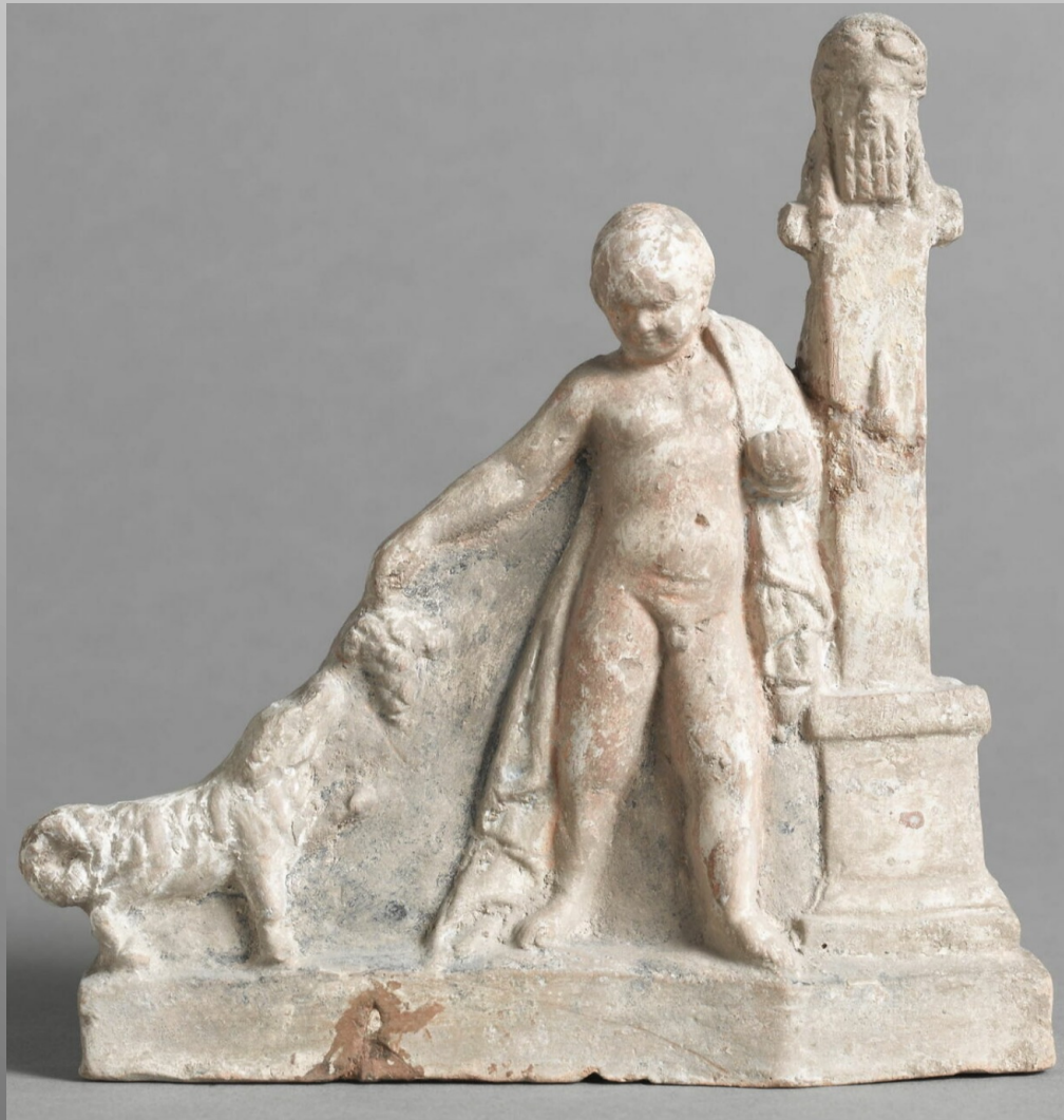
Enfant et chien maltais à la grappe de raisin

(H. 12,5 cm, L. 12,3 cm ; Louvre Myr 309. Myrina, fin I er s. av. n.è.)