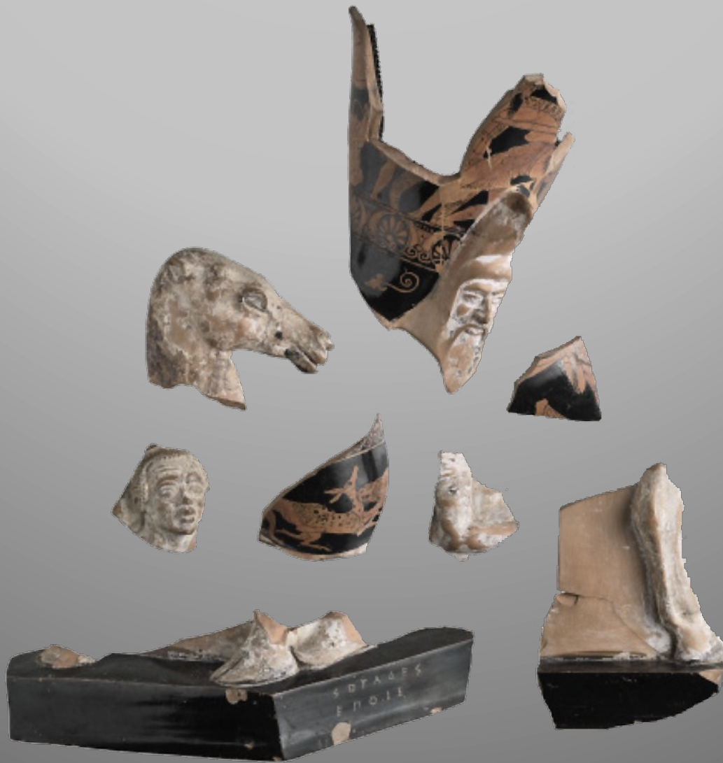
Fragments d'un vase plastique signé Sotadès représentant un Perse menant un dromadaire (Louvre CA 3825. Memphis ; vers 450 av. n.è.)