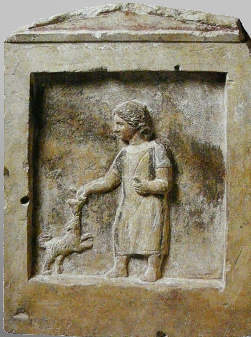
Stèle d'enfant provenant de la nécropole de Chatby

(Alexandrie, II e s. av. n.è. ; d'après S. Walker, P. Higgs [eds.], Cleopatra of Egypt from History to Myth , Londres, 2001, p. 125, n° 152)