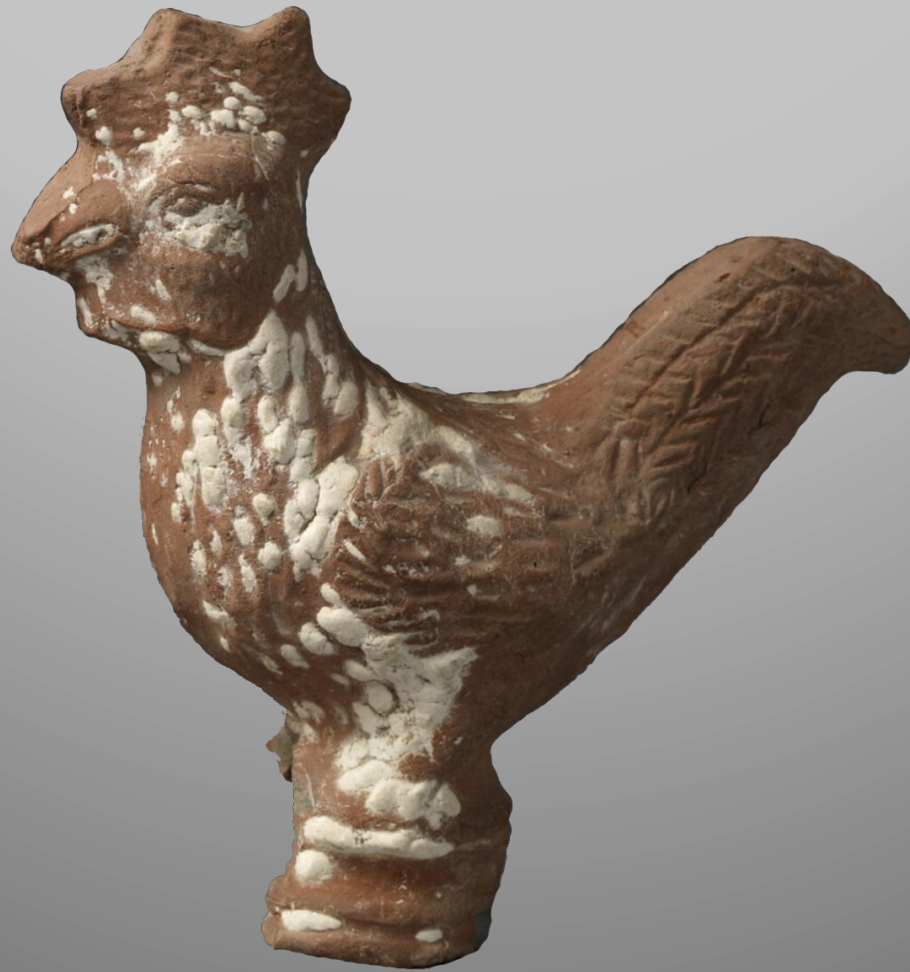
Figurine de coq avec reste d'enduit

(H. 13,5 cm, L. 5,6 cm ; Louvre E 27424. Égypte, époque romaine)