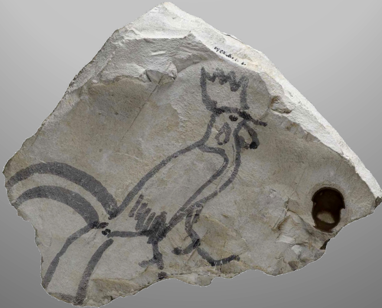
Dessin d'un coq sur ostracon

(H. 16,20 cm, L. 15,50 cm ; BM EA68539. Vallée des Rois, XIII e -XI e s. av. n.è.)