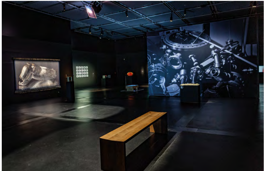
Figure 1. Vue d'ensemble de l'exposition « Le Rayon Extraordinaire » en salle Anita Conti des Champs Libres à Rennes, du 15 novembre 2022 au 5 mars 2023. Une vingtaine d'œuvres ou de séries ont pu être présentées à un public de près de 30 000 personnes.

Le parcours de l'exposition présente une logique à la fois chronologique et esthétique : les premières œuvres s'inspirent des concepts fondamentaux de la polarimétrie (rayons ordinaires/extraordinaires, surface des indices de Fresnel, biréfringence,...) tandis que la seconde partie de l'exposition aborde les notions de perception de cette information « cachée », liées à l'imagerie polarimétrique et la vision polarimétrique dans le règne animal. La charnière entre ces deux parties s'opère au niveau de la pièce « Tu contemples ton âme », où une