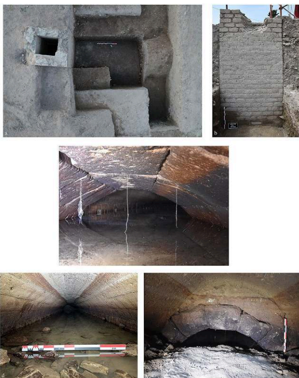
Fig. 10. a-b) Vue du secteur fouillé en 2022 avec le puits PT74125 et l'extrados de la voûte VT74151 ; c) Vue de la voûte en grands blocs (VT74152) du collecteur ; d) Vue de la partie est du collecteur ; e) Vue de la partie ouest du collecteur.