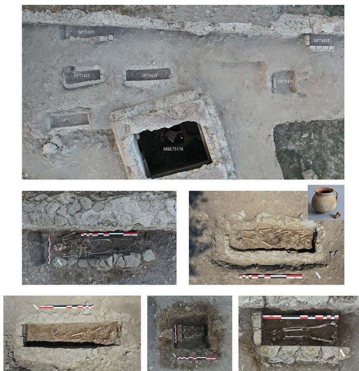
Fig. 8. a) Vue de la zone nord du secteur E73 ; b) La sépulture SP73315 ; c) La sépulture SP73422 et le mobilier funéraire US 735254 ; d) La sépulture SP73428 ; e) La sépulture SP73432 ; f) La sépulture SP73451.