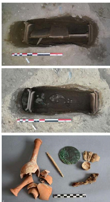
Fig. 6. a) Vue de la sépulture en fosse avec couverture de tuile en bâtière SP73443 ; b) Vue du squelette et du mobilier en place ; c) Le mobilier funéraire US 73529.