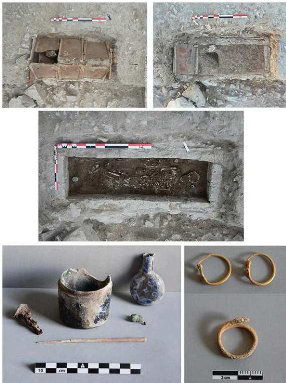
Fig. 7. Vue de la sépulture a bauletto SP73311 et détail du mobilier funéraire US 73439.