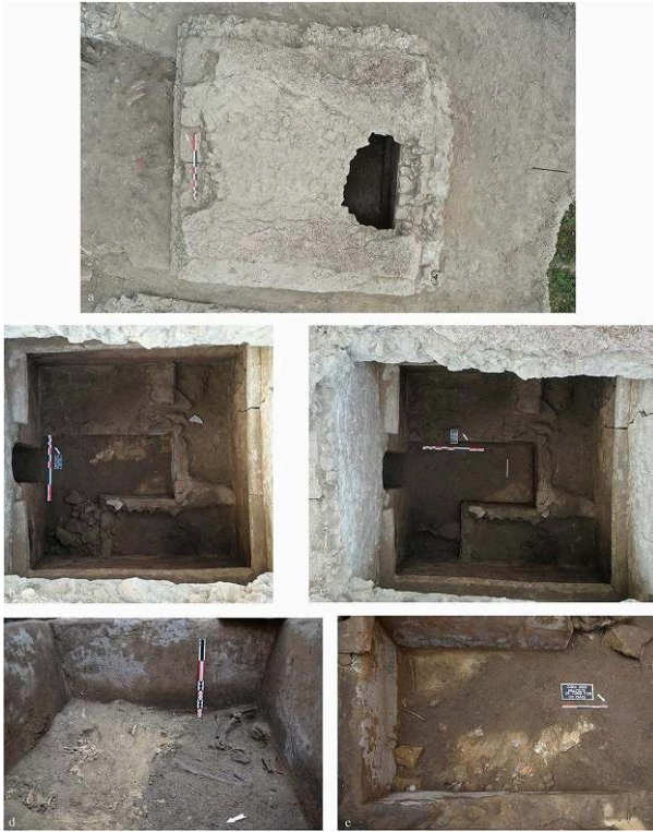
Fig. 3. Vues de l'extérieur et de l'intérieur du mausolée MSL73178.