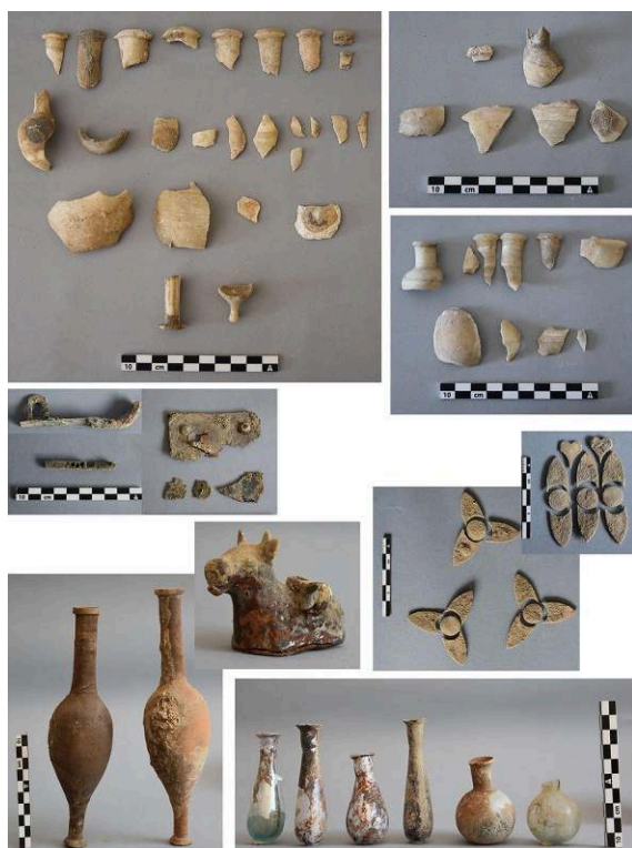
Fig. 4. Éléments des mobiliers funéraires du mausolée MSL73178.