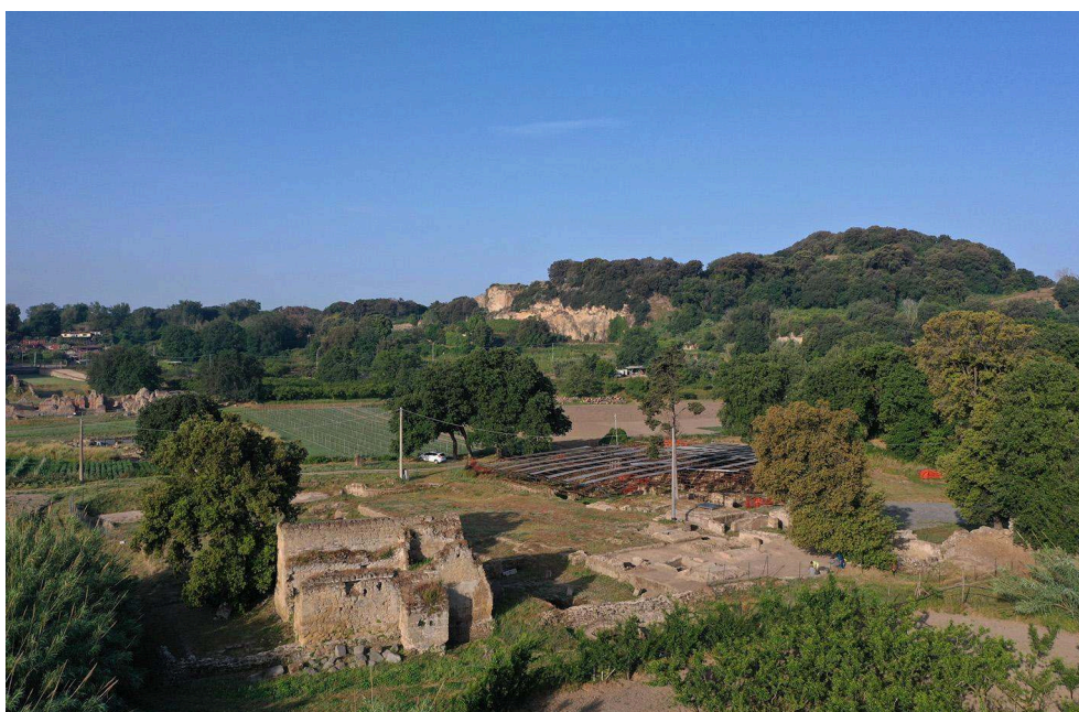
Fig. 1. Vue aérienne de Cumes et du secteur au nord-est de la porte Médiane.