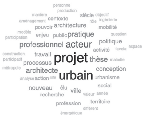
Figure 1 - Le projet, l'urbain et les acteurs au cœur des thèses