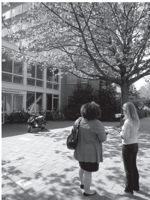
Figure 3 - Réalisation d'un parcours multisensoriel au sein du quartier WGT à Amsterdam en 2010.

thèse, mes intérêts scientifiques évoluent, me permettant de consolider et de croiser des travaux existants sur les expériences sensorielles, esthétiques et affectives de la ville, mais aussi d'apporter des éléments de compréhension sur la considération du sensible dans l'ensemble du processus de projet, et donc aussi par les maîtrises d'ouvrage et d'œuvre et leurs assistances – sujet encore non traité par la recherche française. Outre une volonté d'analyse des enjeux socio-politiques de la fabrique urbaine et d'une « critique sensible » de l'urbain questionnant notamment les processus d'(hyper)esthétisation en cours (travail que j'amorce dans le cadre du projet exploratoire Proseco financé par l'Idex Grenoble-Alpes 6 ), il s'agit aussi de questionner les re-professionnalisations et inter-professionnalités en œuvre quand le sensible entre dans le jeu de la production urbaine.