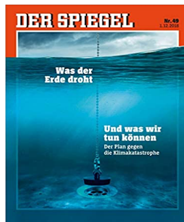
FIG. 8 : Der Spiegel 49/2018

La métaphore du DÉLUGE n'est pas sans rappeler celle de la VAGUE, elle aussi fréquente dans le contexte pandémique à travers les expressions erste, zweite, dritte, vierte Welle et les composés Coronawelle, Pandemiewelle et Wellenbrecher (Klosa-Kückelhaus 2020e) :