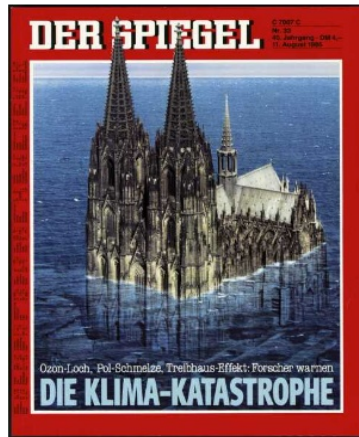
FIG. 6 : Der Spiegel 33/1986