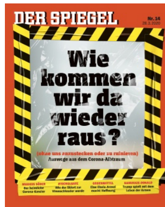
FIG. 4 : Der Spiegel 14/2020

Les médias ont volontiers recours aux métaphores renvoyant à la catastrophe ultime, l'APOCALYPSE, évoquant des mythes et des peurs ancestrales, phénomène qui n'est pas nouveau puisque J. Klein, dès la fin des années 1980, parlait, dans le contexte des mouvements écologiques et antinucléaires, de 'langue de l'apocalypse' ( Sprache der Apokalypse ; 1989 : 39) 37 . Le dossier thématique « Die (ewige) Angst vor der Apokalypse » ( Die Zeit )