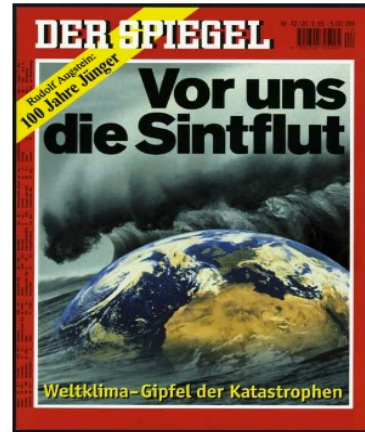
FIG. 7 : Der Spiegel 12/1995