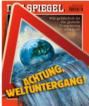
FIG. 1 : Der Spiegel 45/2006