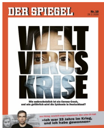
FIG. 3 : Der Spiegel 10/2020