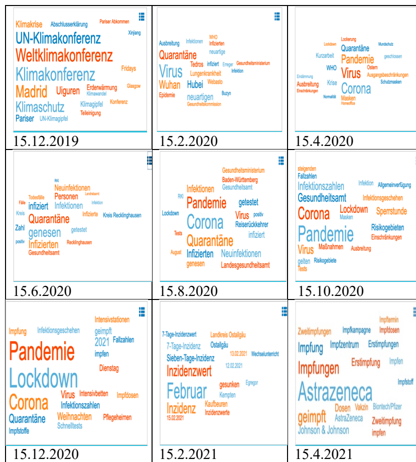
TAB. 2. – Les mots les plus fréquemment employés dans les médias (décembre 2019 – avril 2021)

Ces relevés font clairement apparaître le changement de priorité : s'il était toujours largement question du changement climatique en décembre 2019, c'est le virus qui, à partir de février 2020, se retrouve au centre de l'attention médiatique. Les mots reflètent par ailleurs l'évolution de la crise sanitaire et sa gestion par les pouvoirs publics : ainsi, on relève en février 2020 les termes Wuhan , Virus et Quarantäne ; en avril 2020, il est question de Krise , Ausgangsbeschränkungen ('limitations de déplacement'), Schutzmasken et Homeoffice , en juin, de Genesung ('guérison') et de tests effectués ( getestet ), en août, de Reiserückkehrer