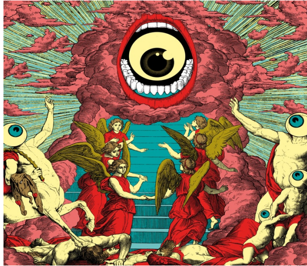
FIG. 5 : L'apocalypse (Elzo Durt)

met en lien les discours publics sur la crise climatique et la crise sanitaire :