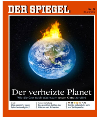
FIG. 2 : Der Spiegel 9/2015