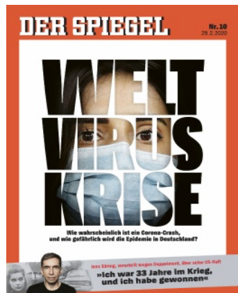
FIG. 3 : Der Spiegel 10/2020