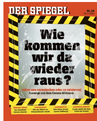
FIG. 4 : Der Spiegel 14/2020

Les médias ont volontiers recours aux métaphores renvoyant à la catastrophe ultime, l'APOCALYPSE, évoquant des mythes et des peurs ancestrales, phénomène qui n'est pas nouveau puisque J. Klein, dès la fin des années 1980, parlait, dans le contexte des mouvements écologiques et antinucléaires, de 'langue de l'apocalypse' ( Sprache der Apokalypse ; 1989 : 39) 37 . Le dossier thématique « Die (ewige) Angst vor der Apokalypse » ( Die Zeit )