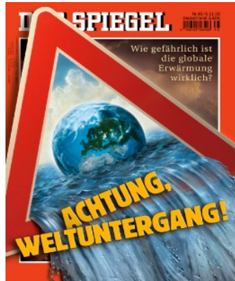
FIG. 1 : Der Spiegel 45/2006