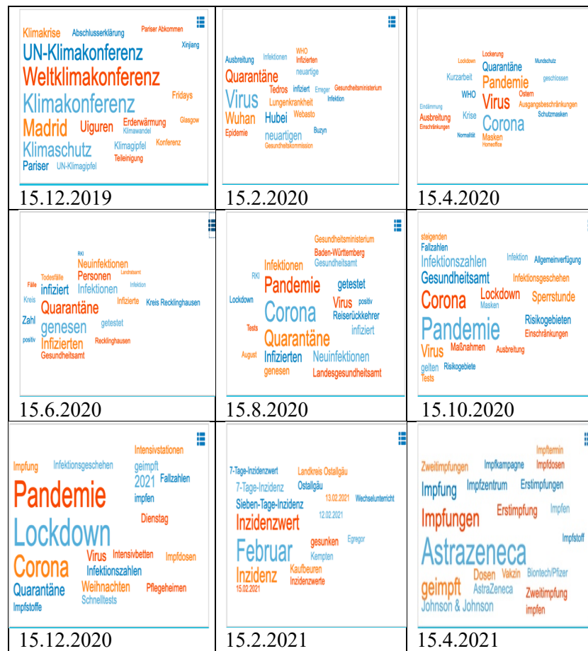
TAB. 2. – Les mots les plus fréquemment employés dans les médias (décembre 2019 – avril 2021)

Ces relevés font clairement apparaître le changement de priorité : s'il était toujours largement question du changement climatique en décembre 2019, c'est le virus qui, à partir de février 2020, se retrouve au centre de l'attention médiatique. Les mots reflètent par ailleurs l'évolution de la crise sanitaire et sa gestion par les pouvoirs publics : ainsi, on relève en février 2020 les termes Wuhan , Virus et Quarantäne ; en avril 2020, il est question de Krise , Ausgangsbeschränkungen ('limitations de déplacement'), Schutzmasken et Homeoffice , en juin, de Genesung ('guérison') et de tests effectués ( getestet ), en août, de Reiserückkehrer