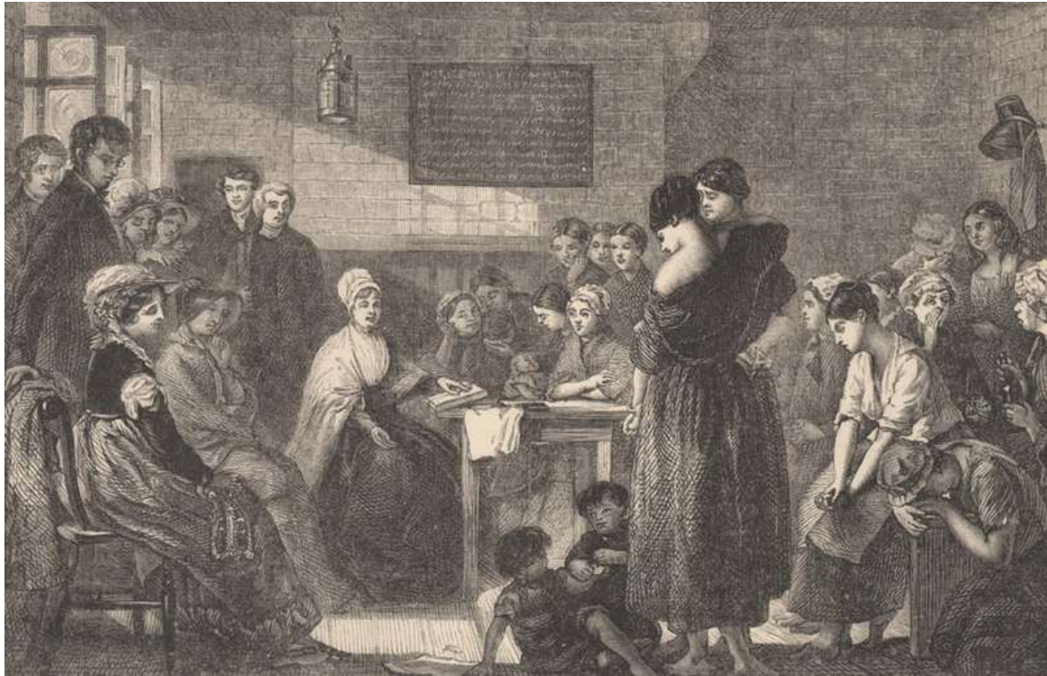
Jerry Barrett, 'Wood engraving of Elizabeth Gurney Fry reading to prisoners in Newgate Prison, London', circa 1860s.

Les impressions laissées par ses visites la ramenèrent à l'une des interrogations centrales des Promenades dans Londres : la situation des femmes en Angleterre et, plus largement, la question de l'éducation. Tristan montra sa sympathie non seulement pour toutes les femmes issues des milieux populaires, dont elle regretta le manque d'instruction, mais aussi son admiration pour certaines autrices anglaises, dont elle salua le succès et qu'elle compara à celui des autrices françaises. Parmi elles, un nom et une œuvre s'imposent : A Vindication of the Rights of Woman de Mary Wollstonecraft. Flora Tristan s'inscrit dans la lignée des revendications prônées par la Britannique et exalte le rôle influent qu'elle occupa durant la Révolution française dans les relations entre la France et l'Angleterre. Un véritable dialogue à travers le temps et l'espace s'établit entre les deux autrices et les Vindications deviennent un intertexte incontournable de l'œuvre de Tristan, cité au début et à la fin des Promenades :