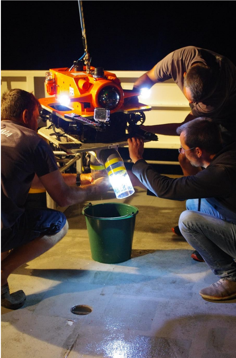
Figure 4. Minuit, sur le pont de l' Amborella , le réservoir du ROV Flipper est ouvert pour y récupérer les coquillages prélevés.