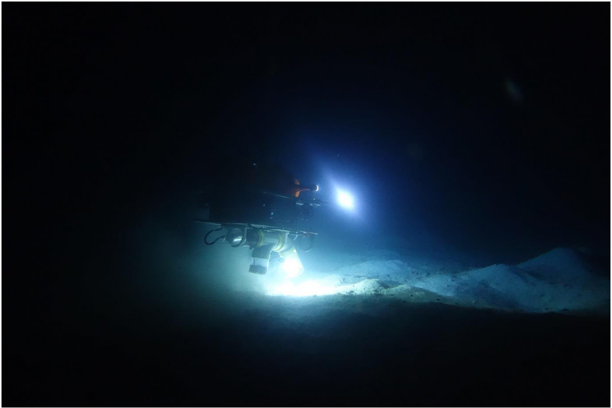
Figure 3. C'est la nuit que les cônes sortent du sable du lagon de Koumac pour chasser leurs proies (vers, mollusques ou poissons, selon les espèces de cônes). Pour les aspirer, le ROV Flipper survole le fond sans le toucher.