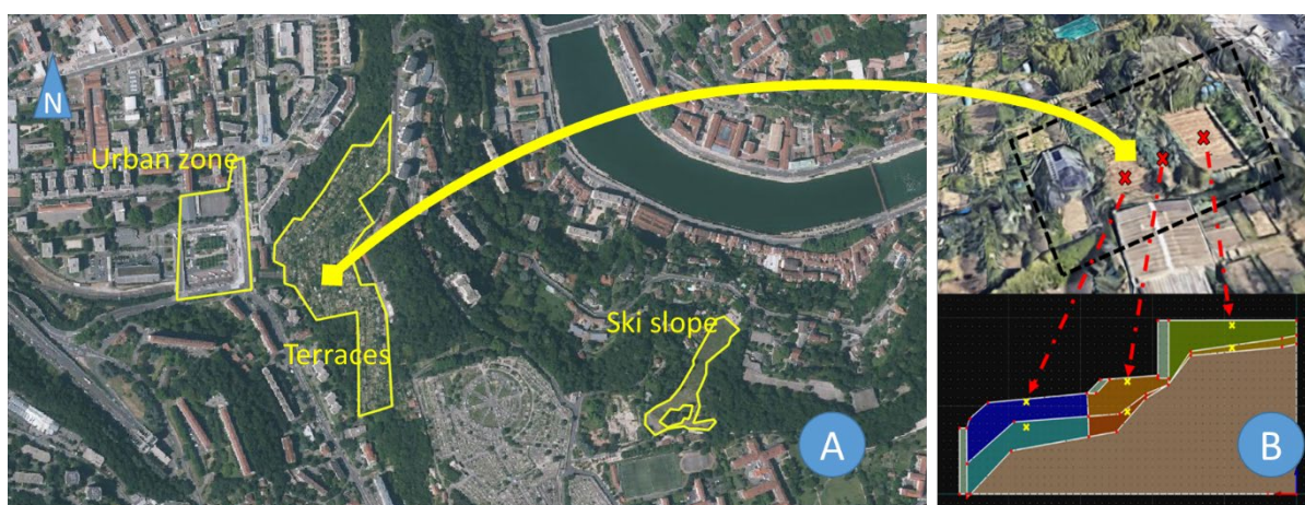
Figure 1 : vue aérienne du site d'étude (A) et profil d'instrumentation d'une séquence de terrasses (B).

La parcelle choisie s'étend sur une superficie de 38 m 2 avec une altitude moyenne de 252 m (Fig. 1A & 1B). L'instrumentation du site et son suivi ont été réalisés de mi-février à fin Aout 2022. Le sol a été caractérisé dans chaque terrasse à deux profondeurs après reconnaissance à la tarière à main de deux niveaux distincts en couleur et granulométrie avant d'atteindre la roche mère. Des échantillons ont été prélevés pour analyse au laboratoire afin d'évaluer la densité apparente et la distribution granulométrique. L'établissement au laboratoire des courbes de réponse Psi-Thêta de la pression (succion) en fonction de l'humidité du sol a été nécessaire pour calibrer les capteurs d'humidité (Waterscout SM100). Six capteurs ont été implantés dans les terrasses selon le schéma de la figure 1B. Un pluviomètre a été installé sur le site avec un pas d'enregistrement de 1 minute. Des pièges à ruissellement ont été implantés dans chaque terrasses pour vérifier l'éventuelle création d'une lame d'eau. Un levé à la mire laser a permis de décrire avec précision la topographie des lieux. Des mesures de conductivité hydrauliques ont été réalisées in situ à l'aide de la méthode Beerkan.