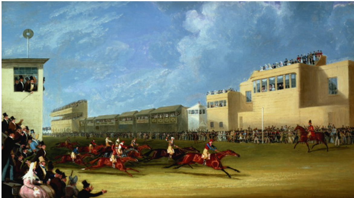
James Pollard, 'The Ascot Gold Cup', 1834, WikiCommons.

En 1834 deux nouvelles courses furent ajoutées. La Royal Hunt Cup, désignée ainsi en l'honneur du 'Master of the Royal Buckhounds', l'officier maître des chevaux de la couronne britannique, rappelait l'influence de la chasse dans l'évolution des pratiques hippiques à Ascot. Fut alors ajoutée, pour la première fois, une nouvelle modalité sportive : la course de galop avec handicap. 8 La deuxième course introduite en 1834 fut la St James's Palace Stakes et, plus tard en 1838, la course de 'The Queen's Vase' pour commémorer le couronnement de la reine Victoria.