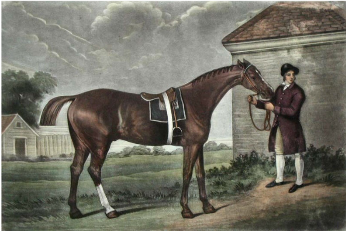
George Stubbs, 'Eclipse at Newmarket with a Groom and a Jockey', 1770.

Un calendrier des événements fut défini dès les premières rencontres sportives et les courses étaient fixées selon les jours de la semaine. La distinction des compétitions devait répondre à deux critères fondamentaux : la race des chevaux concurrents, classés selon leur poids et leur âge, et le prix, d'un montant variable selon le prestige de celle-ci. Quoique le calendrier n'ait cessé d'évoluer, les courses les plus emblématiques, comme la Gold Cup, avaient toujours lieu le jeudi. Elles furent officiellement enregistrées dans l'Annual Racing Calendar à partir de l'année 1727. 7 Dès lors, les festivités démarraient traditionnellement le mardi par l'ouverture royale et les courses, et duraient jusqu'au vendredi, jour où la qualité et l'intérêt des courses étaient moindres en raison du départ progressif du public.