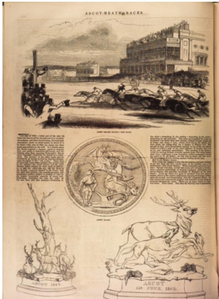
The Illustrated London News (London, vol.1, Jan-Jun 1844).