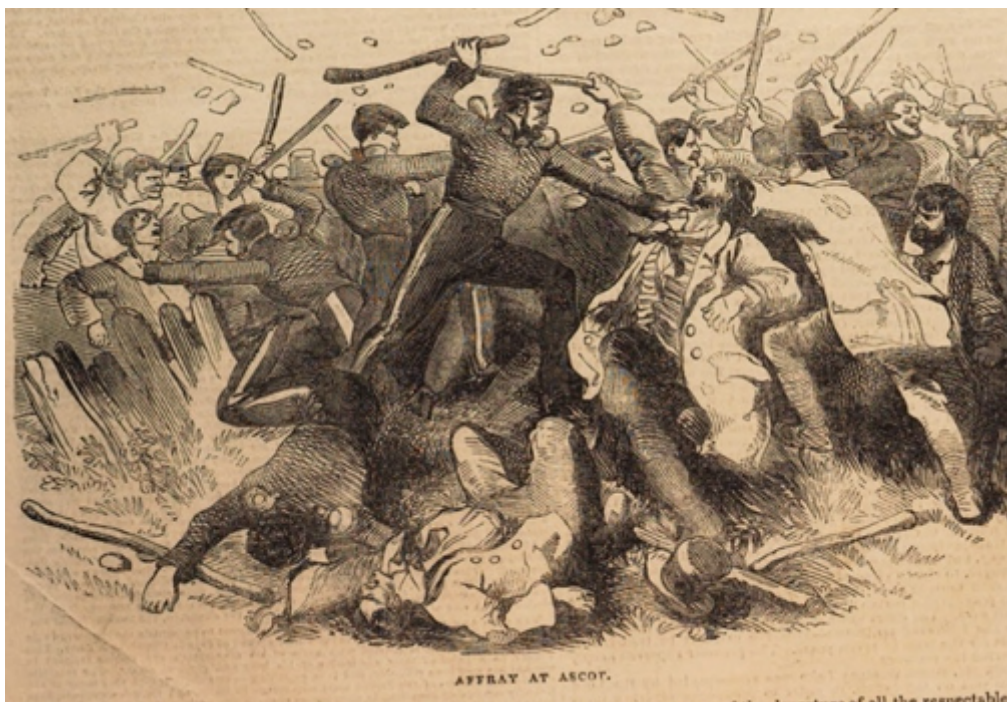
The Illustrated London News (London, vol. 2, Jan-Jun 1843, p. 438).