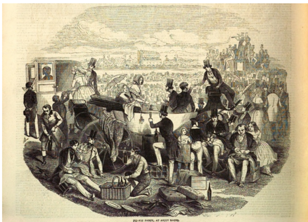
James Smyth, Frederick, 'Pic-nic Party, At Ascot Races', The Illustrated London News (London, vol.1, Jan-Jun 1844, p. 368)

Ce contexte permit l'apparition de nouvelles situations de convivialité et de partage. Étant donné la durée des courses, des intervalles étaient consacrés à des collations pouvant prendre la forme de pique-niques, célébrés notamment lors des visites de personnages illustres. Pendant ces pauses gastronomiques, on buvait du sherry , du gin ou de la bière. Dès les années 1800, sur le terrain d'Ascot, il était possible de consommer de la glace, un produit de luxe, mais aussi d'acheter des rafraîchissements à des vendeurs ambulants ou dans des kiosques. On retrouve ces scènes de 'sociabilisation' autour de mets et de boissons dans les gravures de Frederick James Smyth (1841-1867) :