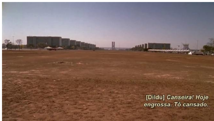
Fig. 3 A cidade é uma só (2011) - Brasília vue depuis la trajectoire pédestre de Dildu.