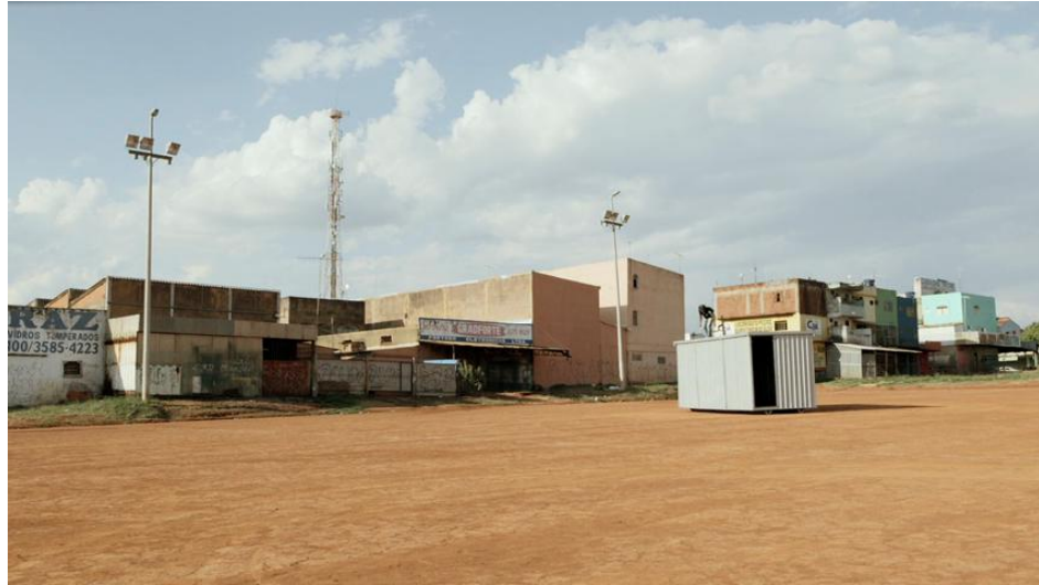
12 Branco sai, preto fica (2014) - Le vaisseau de Dimas Cravalaças.

Le cinéma d'Adirley Queirós comme esthétique de l'auto-construction