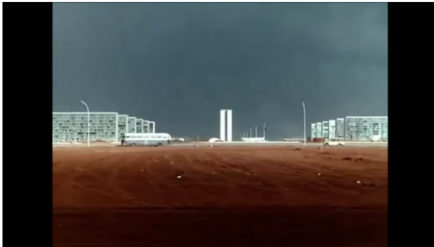
Fig. 4 Brasília, Contradições de uma Cidade Nova (1967) - Brasília, axée dans le plan pilote

Le cinéma d'Adirley Queirós comme esthétique de l'auto-construction