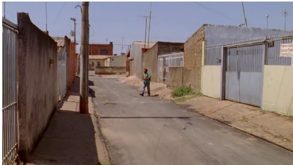
Fig. 9 A cidade é uma só (2011) - Le porte-à-porte de Dildu vers son électorat

ville générée est inséparable de l'expérience qui l'a produite et de l'action politique qu'elle suscite. (...) L' "image bonne" n'est donc ni simplement une image ni vraiment globale, mais elle est toujours en puissance d'image et en intention de globalité, elle prépare un "urbanisme unitaire" qui "donnerait la totalité du décor de la vie des individus" 24 . Le personnage de Dildu est ainsi central pour aborder l'esthétique d'auto-construction présente dans les films d'Adirley Queirós : le potentiel de la ville compte autant que les bâtiments déjà construits, Ceilândia ne sera certes jamais patrimoine de l'humanité, mais atelier illimité.