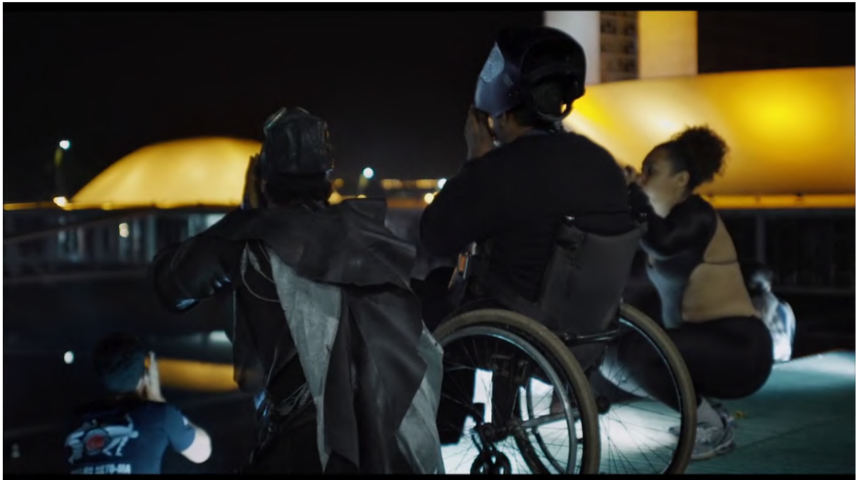
18 Era uma Vez Brasília (2017) - Souffle vers le congrès national