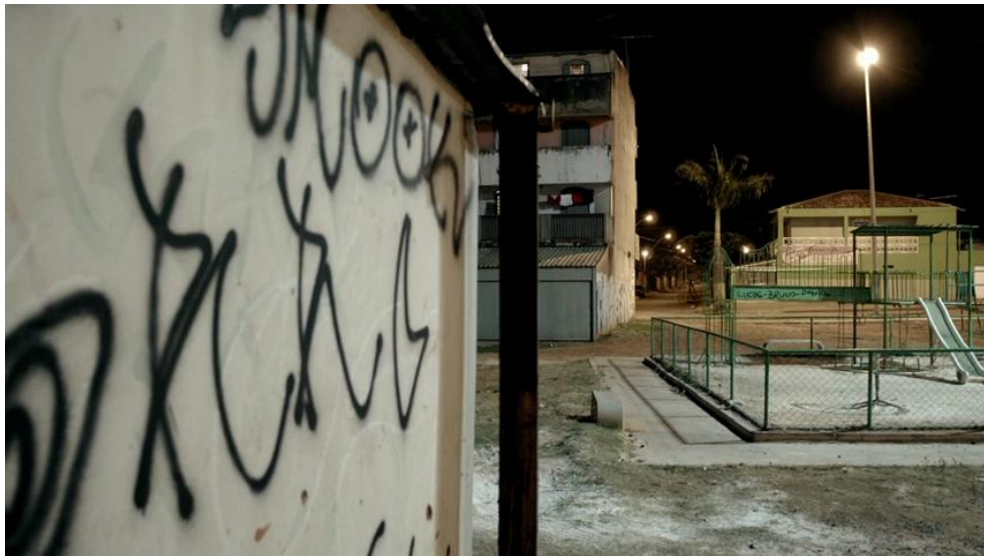
Fig. 6 Branco sai, preto fica (2014) - Premier plan vers le point de vue de la laje.

Dans Branco sai, preto fica , aucun bâtiment de Brasília n'est filmé. C'est le point de vue des habitants de Ceilândia, Marquim et Sartana principalement, exclus de la capitale, qui importe. En portant une attention à l'auto-construction de leurs lieux de vie, immeubles bas, décatis, grillagés, la construction d'un regard depuis ces habitats prend place. L'horizon de la plaine périphérique importe autant que les bâtiments qui peuplent le champ. César Guimarães 21 a proposé l'expression de « point de vue de la laje » (“ ponto de vista da laje ”) pour qualifier la spécificité de l'investissement des espaces vécus dans Branco sai, preto fica . En portugais du Brésil, la « laje » désigne la terrasse des maisons basses et se réfère principalement aux quartiers les plus populaires. Nous entrons dans Branco sai, preto fica par un plan en vue subjective qui nous fait monter progressivement par un ascenseur rudimentaire de la rue où vit Marquim, jusqu'à sa laje . [Fig. 6] Les lajes de Marquim et Sartana seront par la suite les observatoires privilégiés depuis lesquels ils maintiendront le contact avec le voisinage de Ceilândia, où figurent notamment de hauts immeubles en béton, souvent cadrés en diagonale pour souligner que ces signes flagrants de la spéculation immobilière demeurent étrangers à l'âme des quartiers marginalisés. C'est également depuis la laje que les personnages élaboreront l'action finale à l'encontre de la capitale. [Fig. 7, 8]