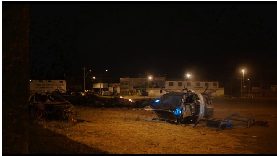
13 Era uma Vez Brasília (2017) - Le vaisseau de WAl4.