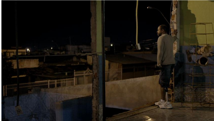
Fig. 7 Branco sai, preto fica (2014) - Ceilândia observée depuis la laje.

Le cinéma d'Adirley Queirós comme esthétique de l'auto-construction