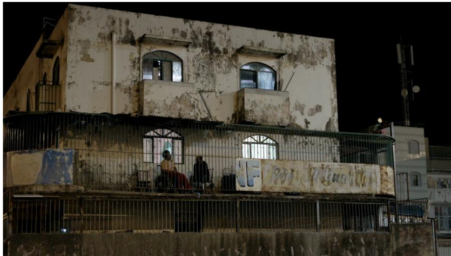
Fig. 8 Branco sai, preto fica (2014) - Contrechamp de la laje de Marquim