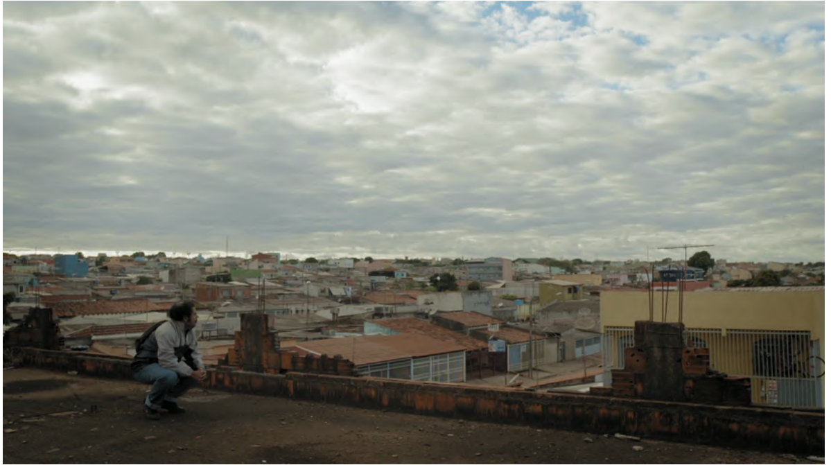
Fig. 19 Branco sai, preto fica (2014) - Naissance d'un paysage, Ceilândia au petit matin

Le cinéma d'Adirley Queirós comme esthétique de l'auto-construction