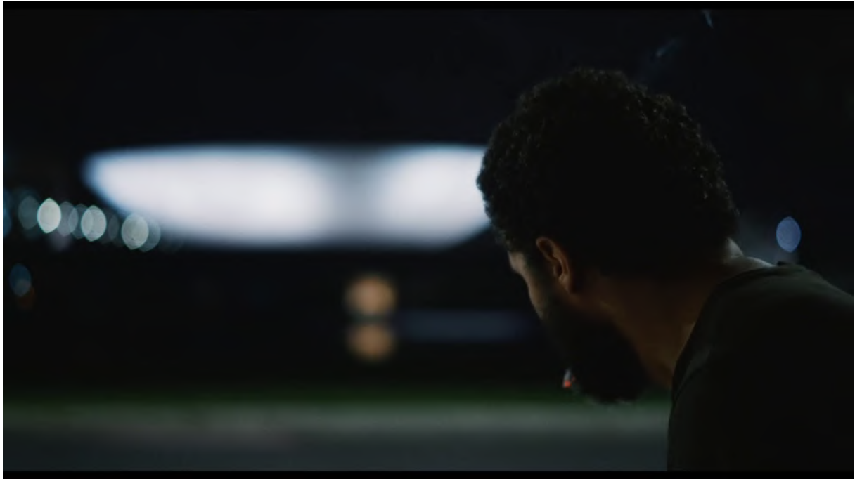
17 Era uma Vez Brasília (2017) - WA14 devant la chambre des députés

brésiliennes avant sa destitution en 2016. Dès lors, en entourant le lieu principal du pouvoir exécutif et législatif de ce nouveau souffle, la communauté activiste de Ceilândia œuvre autant à faire valoir une émancipation périphérique qu'à défendre les droits d'un Brésil démocratique dans son entité. [Fig. 17, 18]