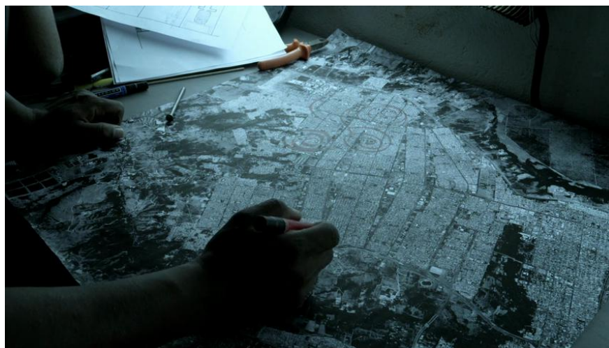
Fig. 16 Branco sai, preto fica (2014) - Pause cartographique dans la préparation de la destruction de Brasília.