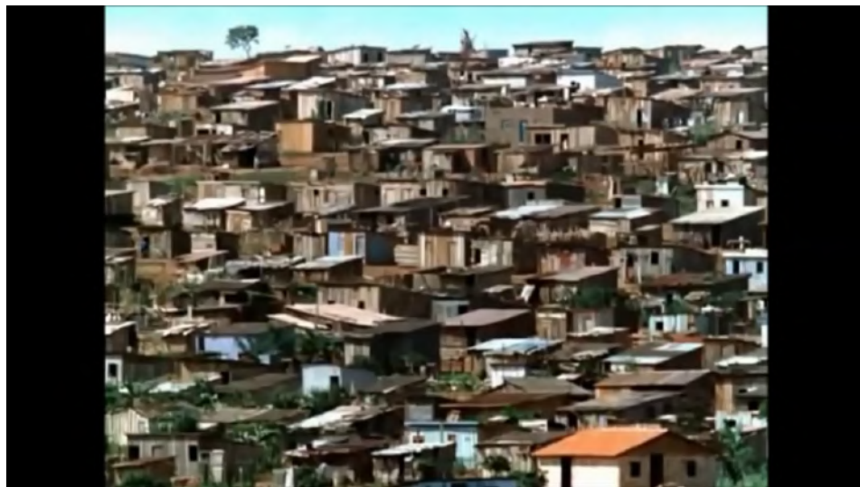
Fig. 5 Brasília, Contradições de uma Cidade Nova (1967) - Bicoques indifférenciées de la misère

De plus, A cidade é uma só? commence là où se terminait Brasília, Contradições de uma Cidade Nova . Le court-métrage d'Andrade s'achevait sur un plan d'ouvriers en pleine construction, avec vue sur un horizon dégagé. Le premier film d'Adirley Queirós s'ouvre avec une bande sonore de chantier, qui accompagne immédiatement après Zé Antonio : ce personnage, en pleine visite d'un terrain périphérique où s'empilent les briques et qu'il souhaite acquérir illégalement pour le revendre à plus haut taux, est le garant clandestin d'un Brésil en croissance perpétuelle, et d'une périphérie toujours plus nouvelle. Mais si Andrade filmait les candangos dans un travail dynamique pour que se finalise Brasília, il montrait néanmoins, grâce à un plan moyen cruel, leurs logis précaires, empilement de baraquements sans figure humaine, image signifiant sans détour et sans issue leur misère. [Fig. 5]