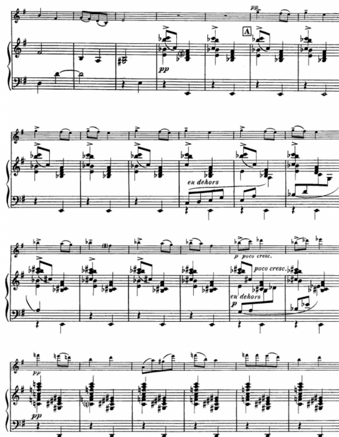
Fig. 2. Maurice Ravel, Berceuse sur nom de Gabriel Fauré (mesures 14 à 38)

le clôturé » 2 . Ce motif du balancement, c'est aussi un héritage d'un topos musical bien français : les compositeurs de la fin du XIX e et du début du XX e siècle (Massenet, Fauré, Debussy et Ravel en tête) ont très souvent utilisé des microstructures faites d'alternances binaires. Ce balancement peut être l'effet d'une simple courbe montante puis descendante, rappelant la manière d'un éventail (comme l'illustrent les premières mesures de la Barque sur l'océan de Ravel), mais le balancement harmonique (ou mouvement de pendule) est sans aucun doute la manière la plus commune de le mettre en œuvre à cette époque, comme celui qui se fait entendre au sein de la Berceuse sur le nom de Gabriel Fauré (1922) du maître Ravel (Fig. 2 ; mesures 17 à 22), souligné par les sauts de registre.