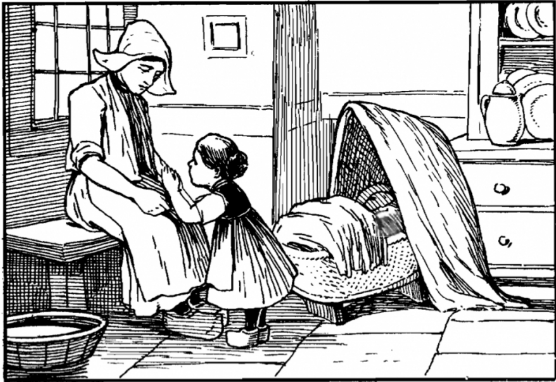
Figure 5. Illustration from “The Dutch Mother’s Goodnight: Lullaby” from Holland Suite by Florence Newell Barbour

27 Each piece in Barbour’s collection included framed, ink-drawn illustrations at the top-left corner, and the picture for “Lullaby” is remarkable for depicting the complexity of the mother-child dyad in the domestic sphere, rather than adhering to sentimentalized idealizations. We see a simple domestic interior, a kitchen, judging by the dish cabinet to the right (see Figure 5), with a woven basket to the right, potentially containing folded linens. A mother sits on a low bench beneath a window, wearing a Dutch cap with turned up wings, a white apron, and wooden clog shoes. Before her is a young girl, a toddler wearing her own set of small clogs and white apron, her face turned towards the mother and away from a pillow-filled cradle. Mothering children is work, sometimes emotionally rewarding, but also emotionally and physically exhausting, a concept communicated by the mother’s worn expression combined with her rolled-up sleeves. Furthermore, mothering children is only a part of the maintenance of the domestic sphere, demonstrated in the kitchen’s double function as both nursery and laundry room. Lastly, the picture