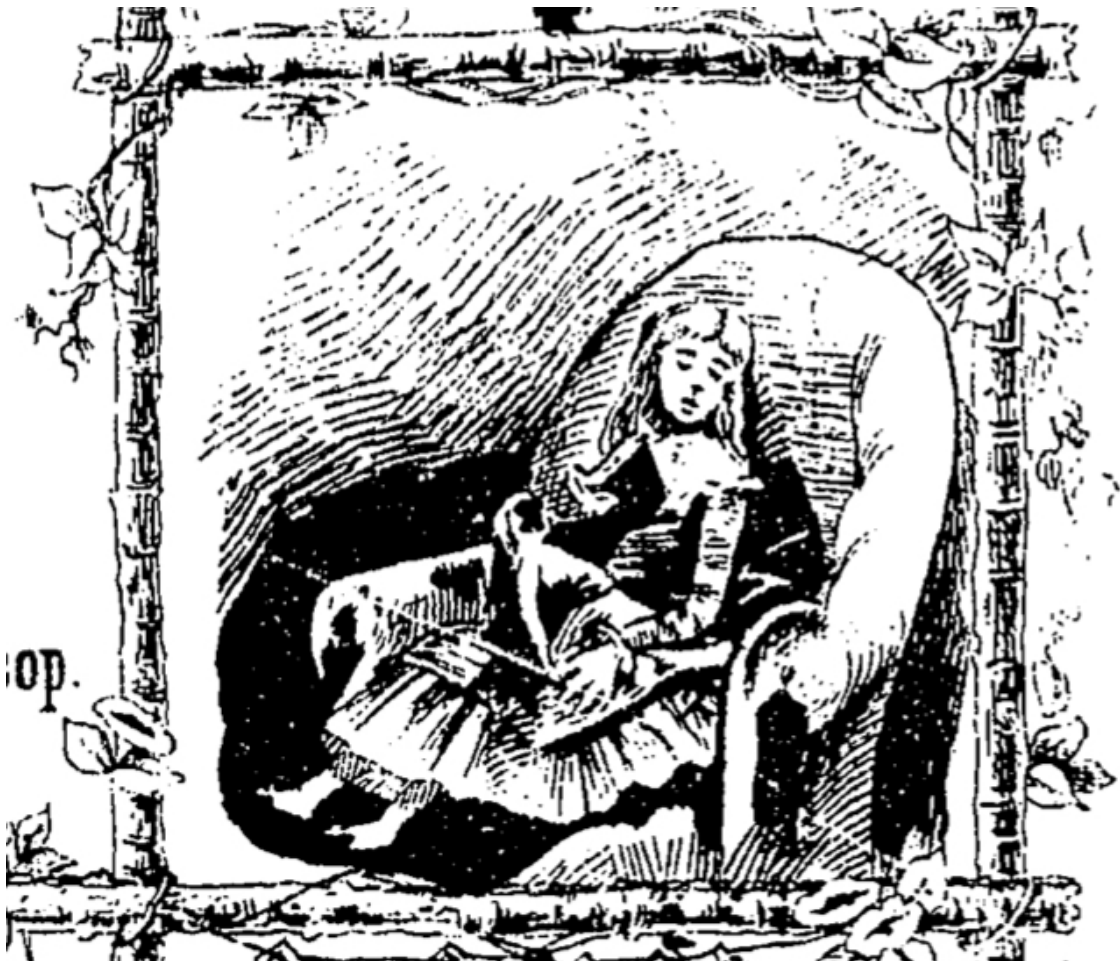
Figure 3. Detail of Scènes enfantines title page by Théodore Lack

22 Returning to the cover page illustration with this ending in mind, we can now interpret the positioning of Yvonne's body as the posture of a sleeping child, eyes closed, head tilted slightly to the left, having succumbed to the soothing effects of her own lullaby play. With this final in-score text, Lack has shifted the piece significantly, yet almost imperceptibly, from a depiction of a child at play to one of a child at sleep. Yvonne had been exercising her creative agency over an inanimate plaything, but when she herself falls asleep, she becomes powerless, an inanimate plaything of an adult, who has placed her in the passive and static position of a doll. To what extent did the music ever truly express the voice of the child? Or does it rather ventriloquize the child in order to give voice to the hidden adult's aetionormative perspective on childhood?