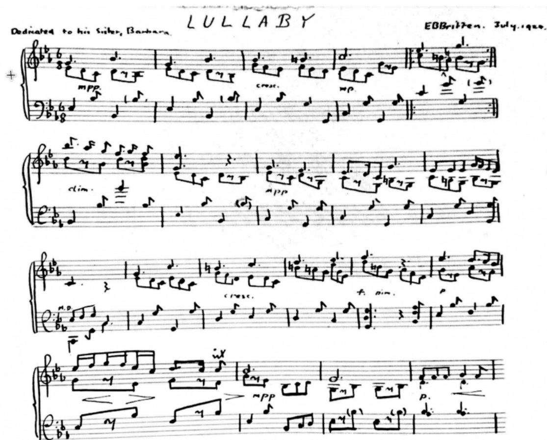
Fig. 2: “Lullaby in Eb”, 1924 (Britten 1924b)