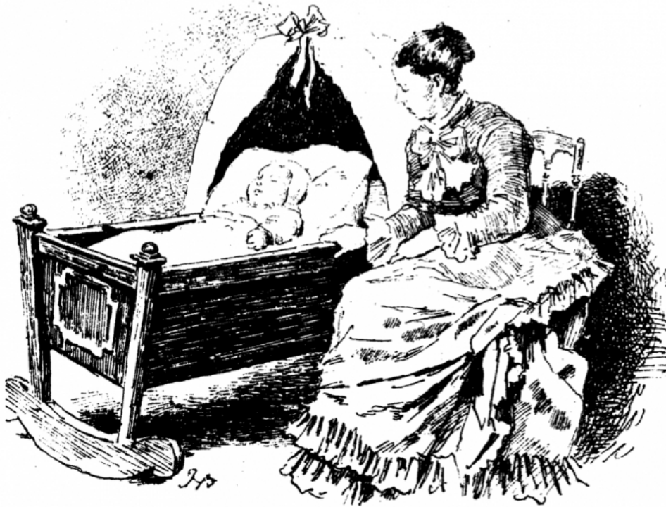
Figure 1. Illustration by Charles Henri Pille for “Berceuse” in Vingt pièces enfantines by Francis Thomé