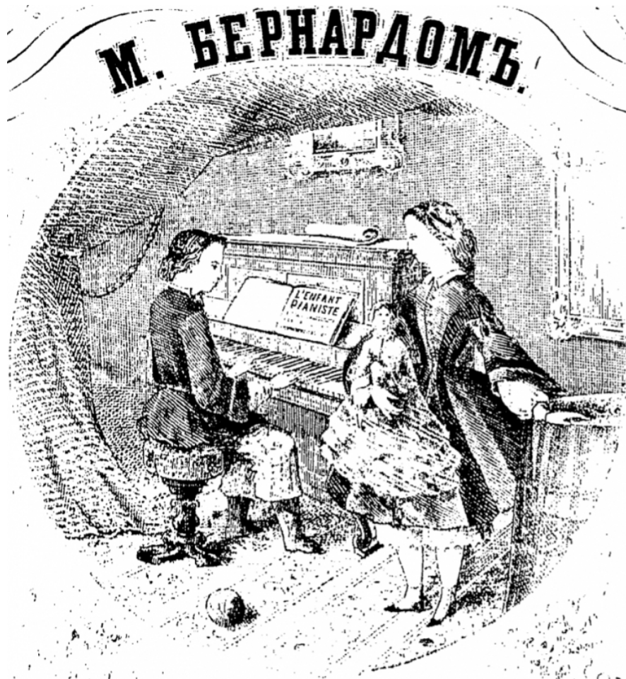
Figure 2. Illustration by unknown artist for L'enfant pianiste by Matvei Ivanovich Bernard