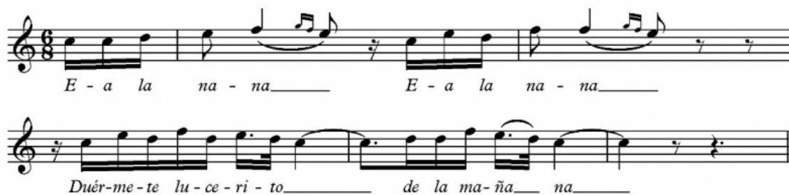
Fig. 8. Transcripción de Nana II , de Francisco Rodríguez Marín (1882)