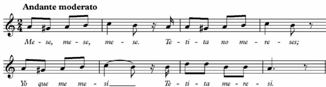
Fig. 7. Transcripción de Nana I , de Francisco Rodríguez Marín (1882)

marco de esta órbita machadiana de recopilación de cantares tradicionales, se publica Cantos populares españoles, recogidos, ordenados e ilustrados por Francisco Rodríguez Marín (1882) , en cuyo tomo I, sección 1ª, se incluyen cuatro nanas. Veamos el arranque de la primera: