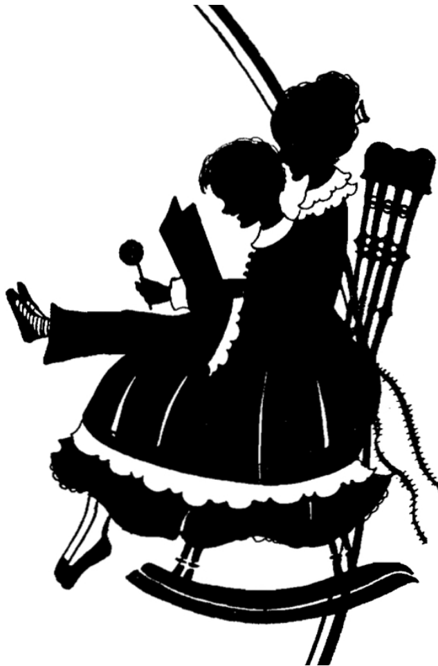
Figure 6. Detail of Four Duets for Two Beginners title page by Mrs. Crosby Adams