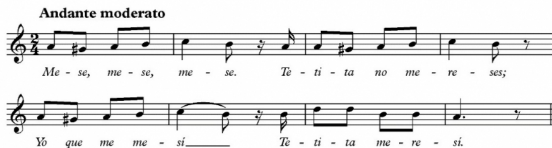
Fig. 7. Transcripción de Nana I , de Francisco Rodríguez Marín (1882)

marco de esta órbita machadiana de recopilación de cantares tradicionales, se publica Cantos populares españoles, recogidos, ordenados e ilustrados por Francisco Rodríguez Marín (1882) , en cuyo tomo I, sección 1ª, se incluyen cuatro nanas. Veamos el arranque de la primera: