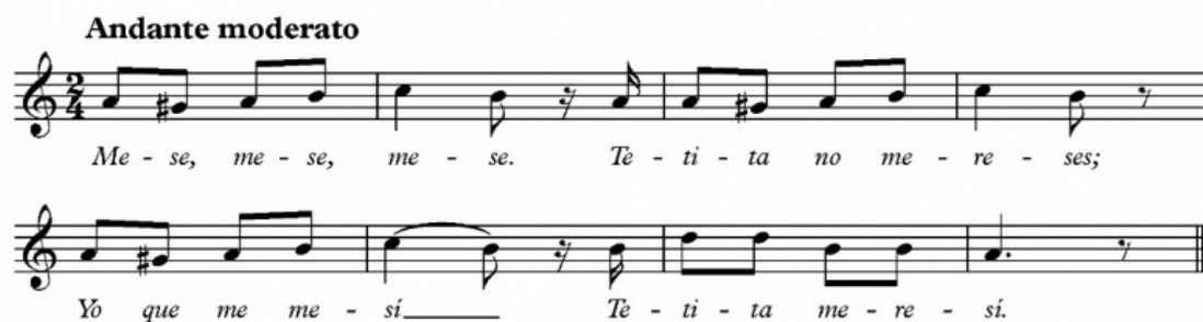
Fig. 7. Transcripción de Nana I , de Francisco Rodríguez Marín (1882)

marco de esta órbita machadiana de recopilación de cantares tradicionales, se publica Cantos populares españoles, recogidos, ordenados e ilustrados por Francisco Rodríguez Marín (1882) , en cuyo tomo I, sección 1ª, se incluyen cuatro nanas. Veamos el arranque de la primera: