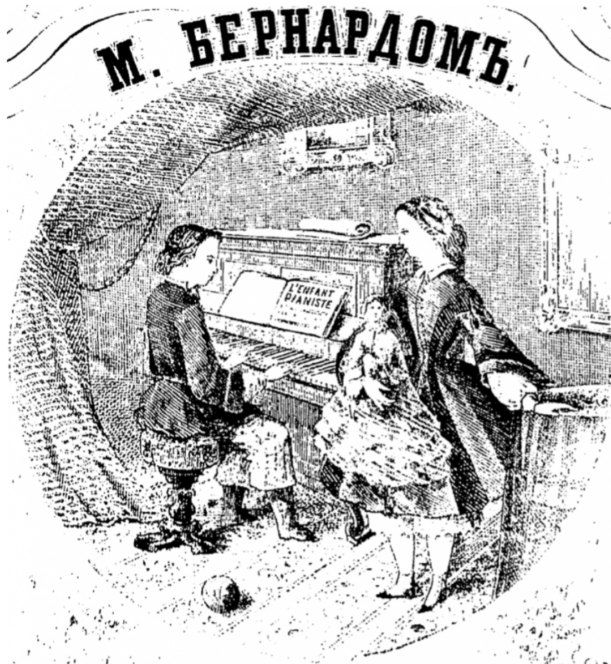
Figure 2. Illustration by unknown artist for L'enfant pianiste by Matvei Ivanovich Bernard