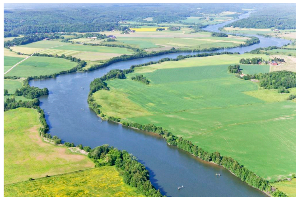
Elfr/Göta älv (Suède)