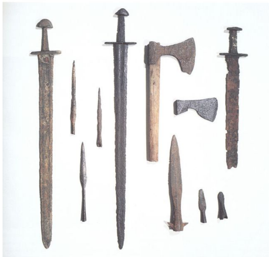
Tissø (Danemark, période viking)