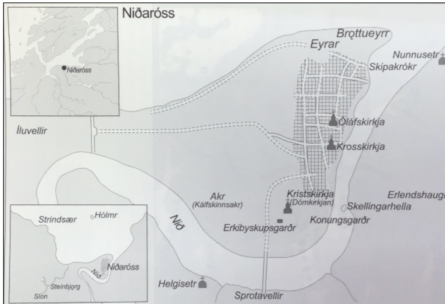
Nidaros (Trondheim) vers 1200