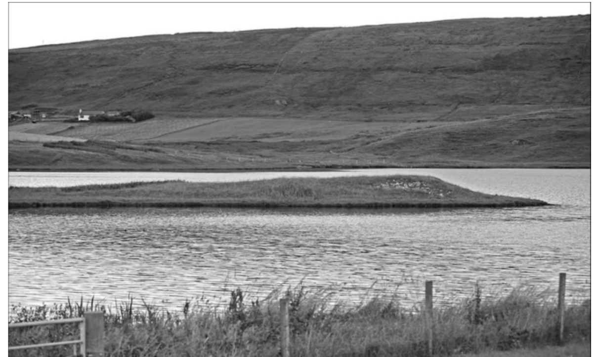
The Law Ting Holm, Loch Tingwall (Shetland)