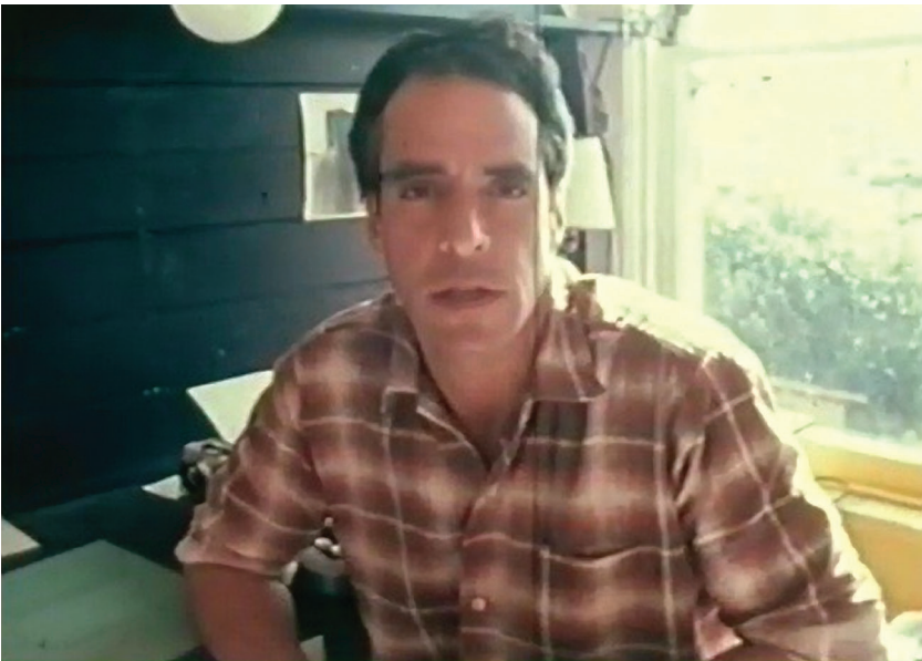
Figures 5 et 6. Scènes de lutte de classe au Portugal (Robert Kramer et Philip J. Spinelli, 1977).