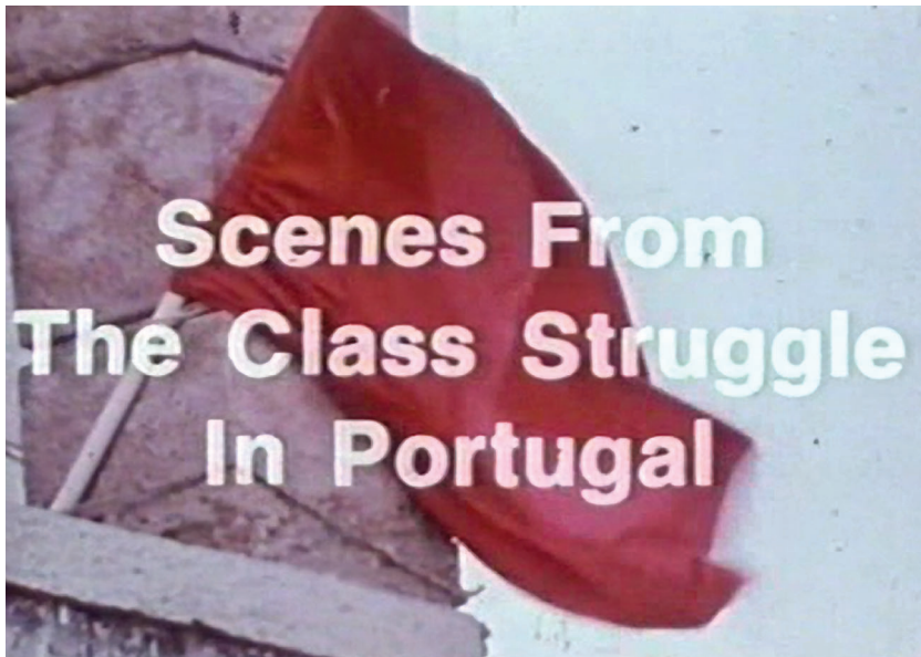
Figure 1. Scènes de lutte de classe au Portugal (Robert Kramer et Philip J. Spinelli, 1977).

Le rapport entre l'inscription du titre à l'écran et le drapeau filmé en plan large puis rapproché donne l'impression qu'il s'agit d'un seul et même motif, comme si la surimpression du titre venait se fondre par contact sur la zone de couleur rouge du drapeau, faisant disparaître le rapport entre l'avant-plan – le titre du film – et l'arrière-plan – le drapeau lui-même. Cette mise en relation permet d'inscrire de façon lisible le point de vue adopté par les réalisateurs