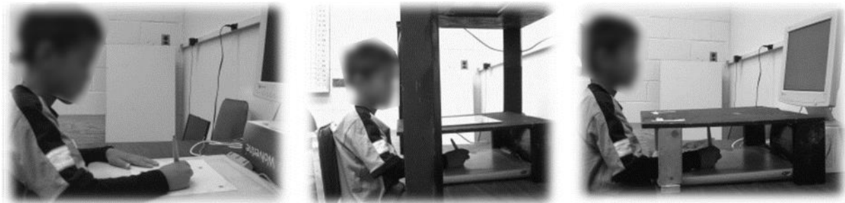
Illustration des trois conditions de tâche graphique testées par Bo et al. (2006) : en condition normale (à gauche), en condition de transformation alignée (au centre) et en condition de transformation verticale (à droite). Adaptée de Bo et al. (2006).

Ces auteurs ont montré que les enfants étaient plus variables dans leur mouvement et qu'ils étaient également les plus impactés par la transformation verticale. Utiliser cette méthodologie de tablette graphique avec contrôle visuel à l'écran face à soi demande une certaine vigilance quant au niveau de maîtrise d'écriture des participants. Cela peut avoir un effet important auprès d'enfants en difficulté d'écriture, surtout ceux qui rencontrent des difficultés d'intégration des informations visuo-spatiales ou d'intégration visuomotrice. Pour pallier ces effets non désirés liés à la perte de rugosité de la surface et au changement de repère visuo-spatial lié à l'utilisation d'un écran, il est possible de fixer une feuille sur la tablette graphique et d'utiliser un stylo à bille compatible avec la tablette. Sachant que les tablettes graphiques sont relativement peu épaisses, cela permet de proposer une situation proche d'une condition écologique d'écriture (de type papier-crayon). Cette dernière situation est la plus utilisée dans le monde de la recherche sur l'écriture manuscrite.