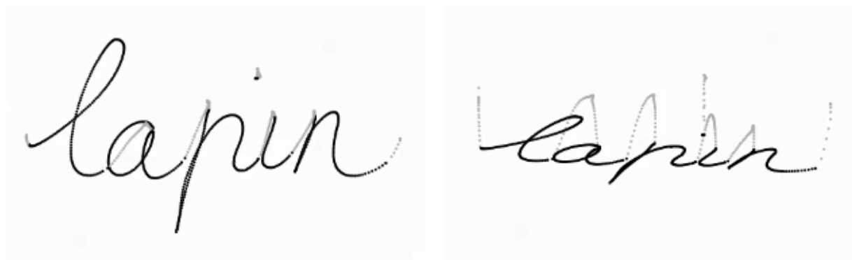
Illustration du mot « lapin » écrit par un adulte.

Note : Les coordonnées x, y et z ont été enregistrées sur tablettes Wacom® Intuos Pro à une fréquence d'échantillonnage de 200 Hz. Les points en noir correspondent aux parties tracées et les points en gris aux levers. À gauche, le mot est présenté en 2 dimensions. À droite, le mot est représenté en 3 dimensions.