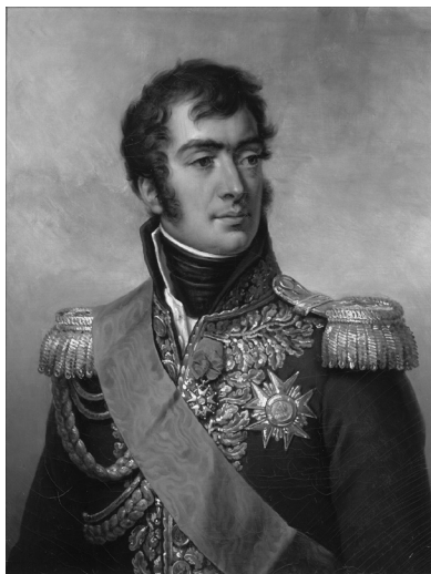
Slika 1. Francoski maršal Auguste Frédéric Louis Viesse de Marmont (1774–1852), prvi guverner Ilirskih provinc (oktober 1809–februar 1811), kot ga je leta 1837 v olju upodobil Jean-Baptiste Paulin Guérin.

gradivom, gledališkimi repertoarji in za izdajanje uradnega lista Télégraphe officiel (prim. Bouchard 2020: 225–242, 232–237; Cuppo 1948: 300–309). Po neuspešnem poskusu tiskarja Giuseppeja Sardija, da bi ljubljansko tiskarno za izdajanje uradnega lista Télégraphe officiel postavil na zdrave temelje, preide novembra 1810 izdajanje lista v roke nekega Beaumesa, v zameno pa Benincasi dodelijo upravljanje javnih knjižnic, na katere pa bo, osebnemu trudu navkljub, le malo vplival zaradi umanjkanja pričakovanih sredstev.