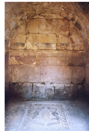
Arpi, Ipogeo della Medusa. Ambiente centrale con emblema figurato (da Mazzei 1995, p. 114, fig. 67)

ARPI, DAUNIA, ETÀ MEDIO ELLENISTICA, ARCHITETTURA, PITTURA PARIETALE, KOINE ELLENISTICA, ABITATO, NECROPOLI priscilla.munzi@cnrs.fr, salvatorepatete@gmail.com, claude.pouzadoux@cnrs.fr