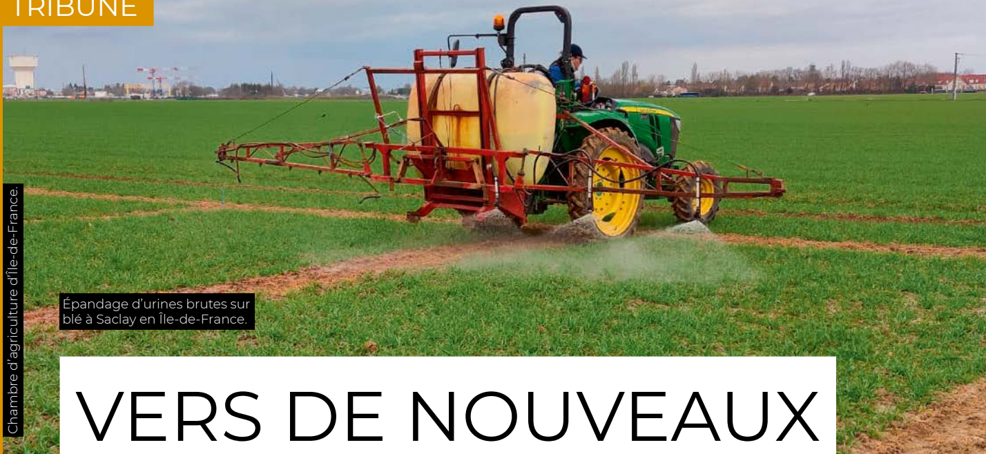
Épandage d'urines brutes sur blé à Saclay en Île-de-France.