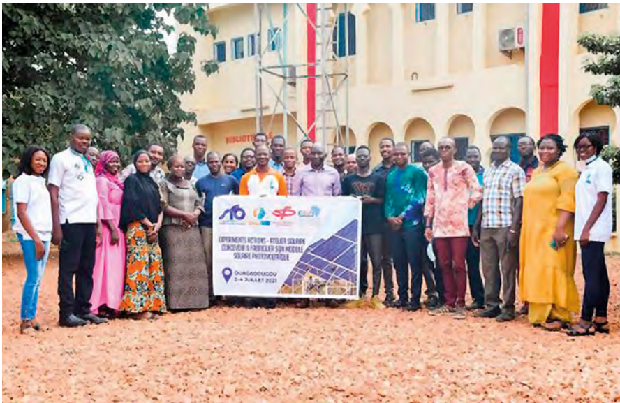
Premier atelier « Physique sans frontières » sous l'égide de la SFP et de la SFO en Afrique à Ouagadougou en juillet 2021. Il était question d'énergie solaire.

ces nouvelles sources tirant souvent profit d'avancées réalisées dans les nanosciences. Pour toutes ces applications, le contrôle de la propagation et du confinement de la lumière est un enjeu de taille, que ce soit en espace libre ou diffusant, au sein de guides