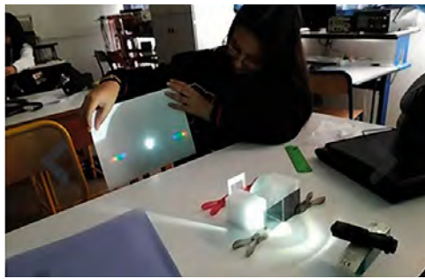
Visualisation de la diffraction grâce au Kit Light Box conçu par la Commission enseignement en collaboration avec l'association Atout Sciences.

Le Club Couches Minces doit sa création à l'omniprésence des couches minces optiques dans un nombre toujours croissant de secteurs industriels, comme l'aérospatial, l'espace, le militaire, les télécommunications et la santé. Dans la plupart des cas, elles constituent un élément clé des performances ultimes des systèmes optiques. La prise en compte des nouvelles applications nécessite une forte structuration spatiale, ce qui a conduit à une forte convergence d'approche avec des techniques initialement développées dans le secteur de la microélectronique. De plus, l'évolution vers le traitement optique des très