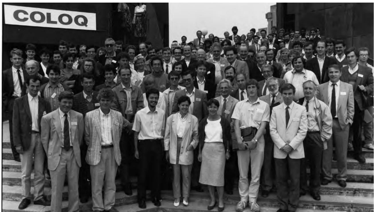
Photo de famille lors de la première édition de COLOQ en 1989.

Le Club Nanophotonique regroupe la communauté s'intéressant aux interactions de la lumière avec la ●●●