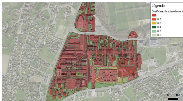
Figure 2 - Carte du campus de l'EPFL à Ecublens selon le coefficient de ruissellement actuel du site (CR = 0.8) réalisé sur QGIS.

Parmi les scénarios futurs de gestion des eaux, la réutilisation de l'eau pour les toilettes est une hypothèse particulièrement intéressante. Les toilettes sont une source de consommation importante d'eau potable à l'EPFL (115'000 m 3 /an sur un total de 140'000 m 3 /an). L'utilisation de l'eau du lac, valorisée par les échangeurs thermiques, a été envisagée dans un premier temps. Malheureusement, avec la prolifération de la moule Quagga dans les eaux du lac, cette variante doit être abandonnée (des traitements de l'eau brute avec du chlore par exemple sont interdits par la législation du Canton de Vaud).