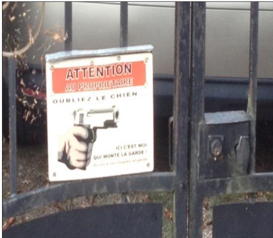
Affichettes sur deux portails d'une commune de Seine-et-Marne. Photo : S. Poisson, printemps 2018

Mais dans cette ambiance chaleureuse, les agriculteurs tiennent une place de choix. Bien souvent enfants du pays, ils sont connus de différentes générations. Très souvent