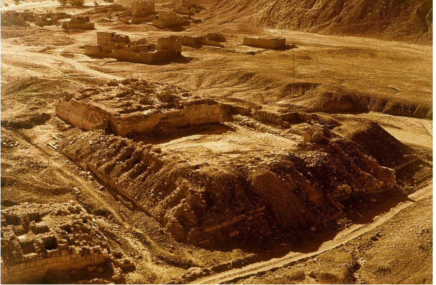
Fig. 1 : Vue aérienne du palais vers le sud.

Ce grand bâtiment se situe à peu près au centre de la ligne défensive septentrionale de Shabwa. Longue de 450 m au total, elle est percée d'une porte monumentale (n° 3) et d'une porte secondaire (n° 2). Venant du nord, de la dépression centrale d'as-Sabkha où sont creusées les mines de sel, la porte n° 3 ouvre sur l'axe principal de la ville orienté nord-ouest/ sud-est. C'est contre cette porte que s'élève le palais (fig. 1). Du côté nord, la face septentrionale du bâtiment à cour centrale (dit bâtiment B) domine la porte n° 3, et, au nord-ouest, le bâtiment annexe (dit C) surplombe une tour d'angle et une courtine (fig. 2). Ainsi le palais, intégré au système défensif de la ville, occupe une position stratégique de premier plan. Les restitutions montrent que sa masse et surtout sa maison-tour centrale (bâtiment A) (fig. 3) contrôlaient tout le secteur. Quatre chapitres sont consacrés à la chronologie de l'édifice qui couvre la période du IV e s. av. J.-C. environ au V e s. ap. J.-C. et à des hypothèses de ses restitutions successives.