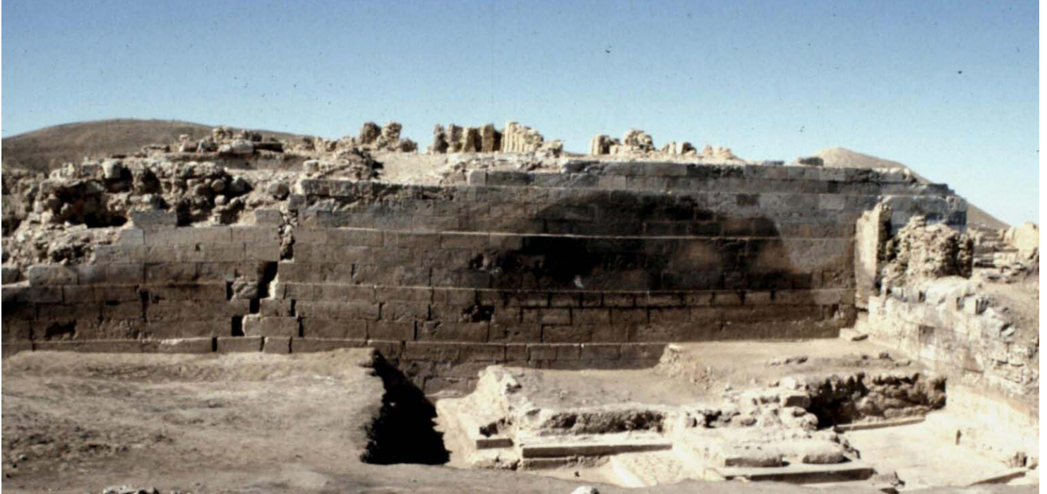
Fig. 3 : Façade orientale du bâtiment A, vue vers l'ouest.

L'édifice n'a livré que peu d'inscriptions, et en tout cas aucune dédicace in situ de construction au nom de Shaqîr , le palais des rois du Hadhramawt. Le principal texte pour l'identification du palais reste la longue inscription al-Iryânî 13 de Mâ'rib qui relate en détail la prise du palais par un contingent des armées sabéennes vers 225-230 ap. J.-C.