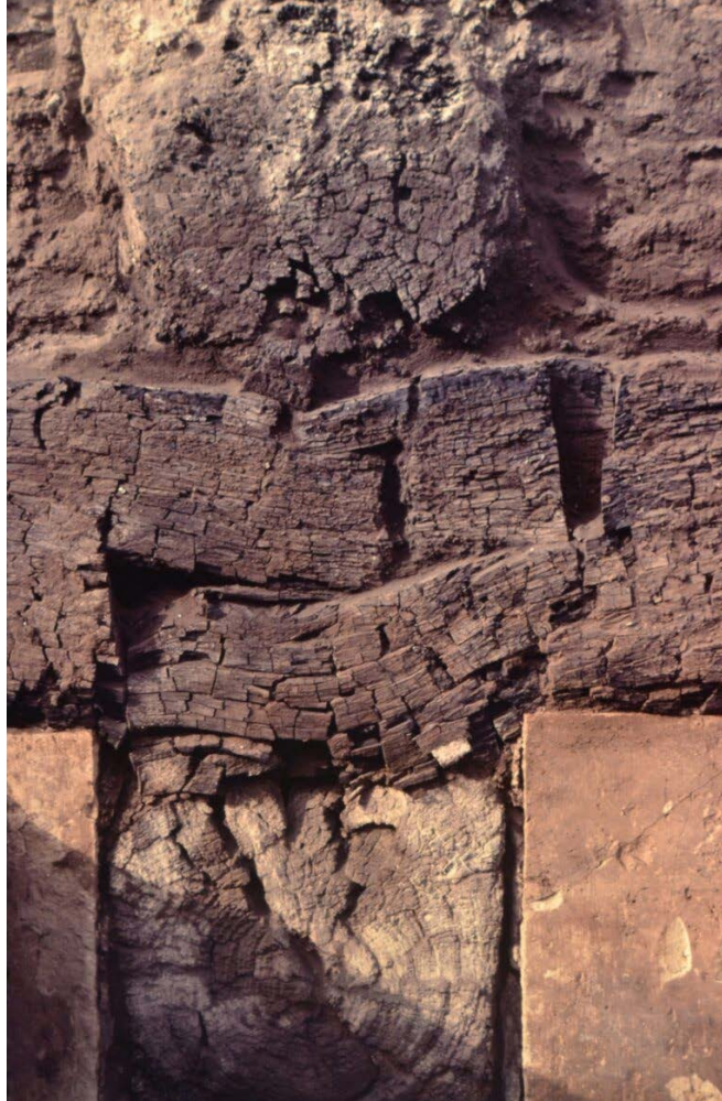
Fig. 8 : Menuiserie en place, bâtiment B, assemblage des poutres.

La maçonnerie de plus de 500 m 2 , faite de carreaux et de boutisses réguliers finement piquetés dans un cadre soigneusement poli, est exceptionnelle pour un bâtiment civil. C'est dire le soin très particulier réservé à ce soubassement et la haute qualification des tailleurs de pierre. Malheureusement, hormis leurs marques incisées, les textes ne nous apprennent rien sur leur formation, leurs rémunérations ou leur organisation socio-professionnelle.