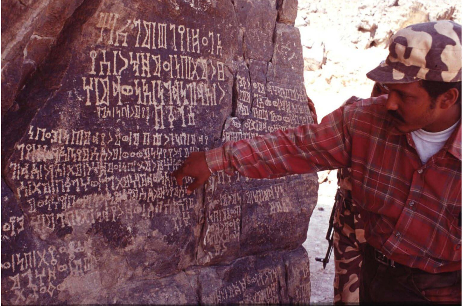
Fig. 4 : Rocher d'al-Uqla. Inscriptions du III e s. ap. J.-C..

Cette identification littéraire du palais Shaqîr demeure certes une hypothèse mais aucun autre bâtiment de Shabwa ne présente une configuration similaire. La fouille de cet édifice offre en outre un nombre conséquent de monnaies de bronze comportant toutes la mention de Shaqîr .