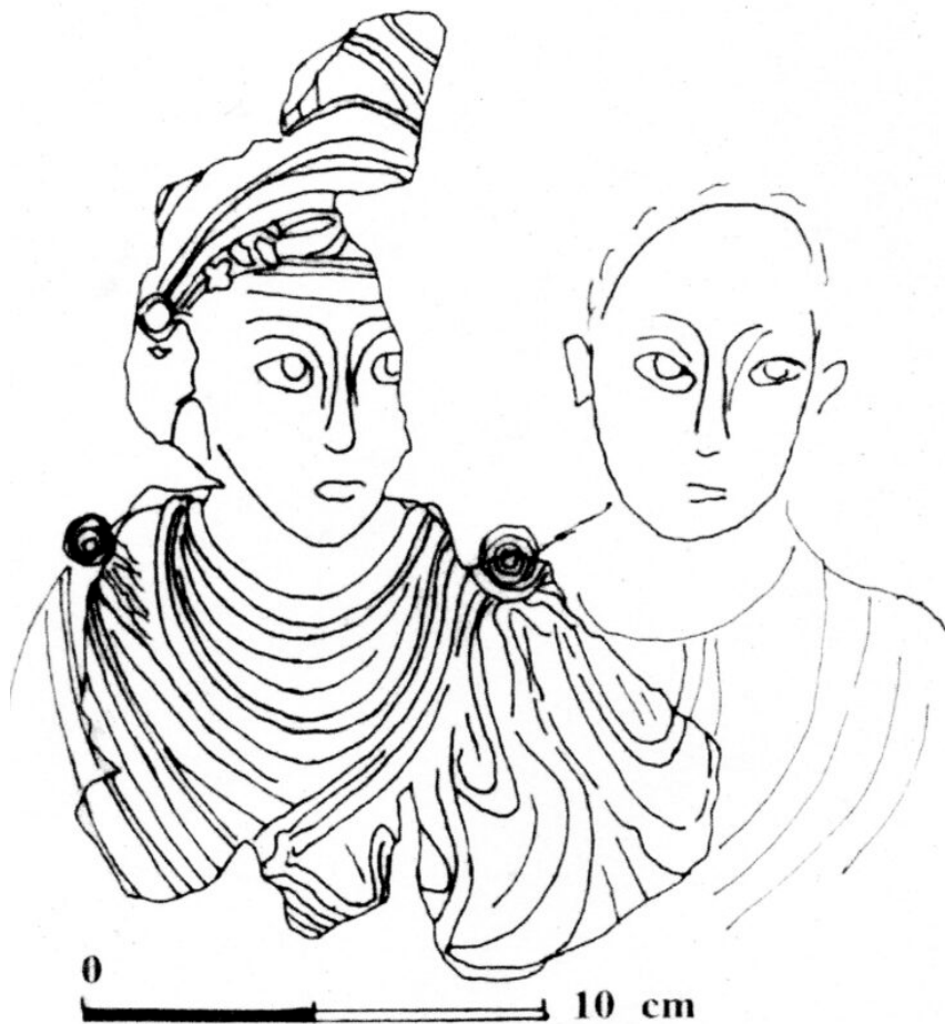
Fig. 7 : Panneau de peinture murale du bâtiment B. Restitution d'un couple (dessin Alix Barbet).