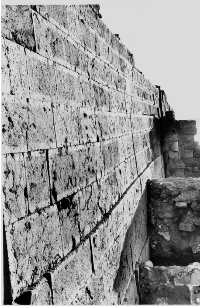
Fig. 5 : Soubassement du bâtiment A, vue vers le sud.

Lors de sa reconstruction, après la destruction de 225-230, l'édifice est rehaussé d'un étage. Au rez-de-chaussée, les panneaux délimités par les ossatures de bois sont ornés de peintures représentant des personnages (fig. 6) et des animaux. Au premier étage, une galerie fait le tour des trois ailes de l'édifice ; ses ouvertures donnant sur la cour sont partagées en leur centre par des meneaux de pierre surmontés de chapiteaux d'une grande richesse décorative (fig. 7) qu'aucun édifice civil de Shabwa n'a jamais égalé. Ce décor est minutieusement publié par Jacqueline Dentzer-Feydy et Alix Barbet.