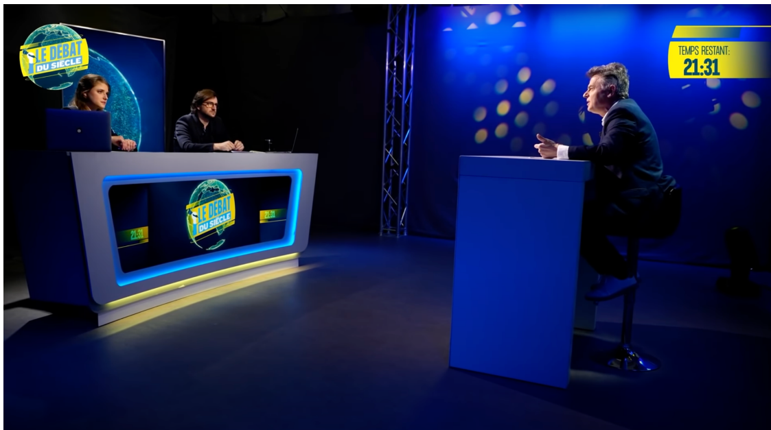
Image n°2 : plan du DDS, durant le passage de Fabien Roussel (1h45m44s)

À l’image des autres débats de la présidentielle 2022, le DDS relève davantage du format du grand oral : il n’y a de confrontation du candidat à une voix dissonante que par l’intermédiaire de l’animateur et l’animatrice de l’émission. Les protagonistes y voient une manière de privilégier l’information au divertissement :