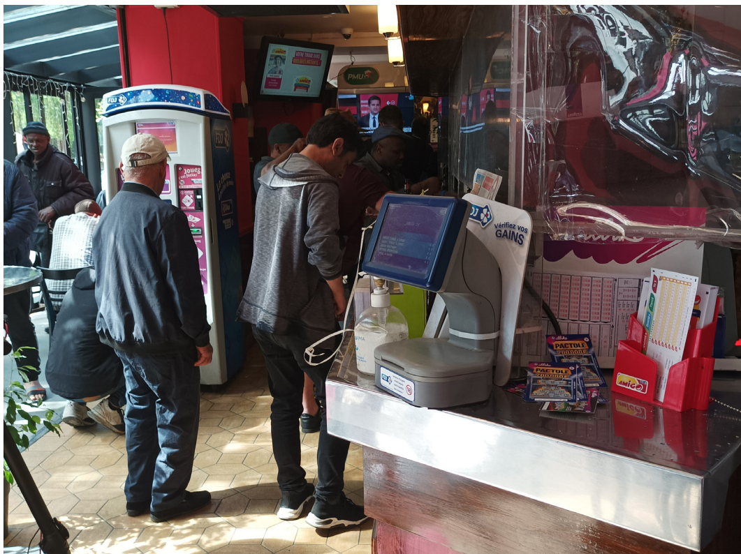
Figure 4 : Vie des points de vente de jeux d'argent à Aubervilliers. En haut les turfistes se regroupent devant les écrans TV du bar-PMU Le Celtique pour suivre la course du moment. En bas, un groupe de parieurs prennent un café devant le Madison.