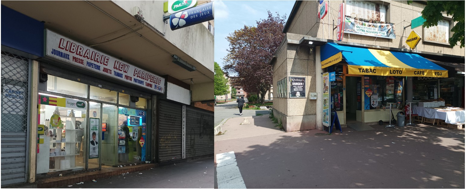
Figure 2 : Localisation et typologie des points de vente de jeux d'argent PMU et FDJ à Aubervilliers en 2022. (Nicolas Brun, 2023)

Localisation et typologie des points de vente de jeux d'argent à Aubervilliers en 2022