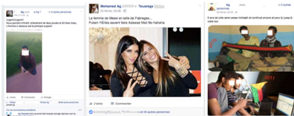
a) b) c)