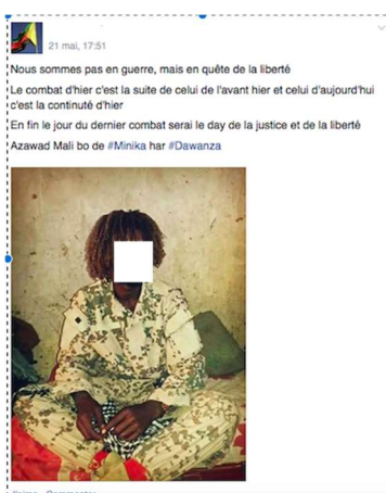
Fig. 8 Le hashtag élément d'appui à la lecture de la photographie