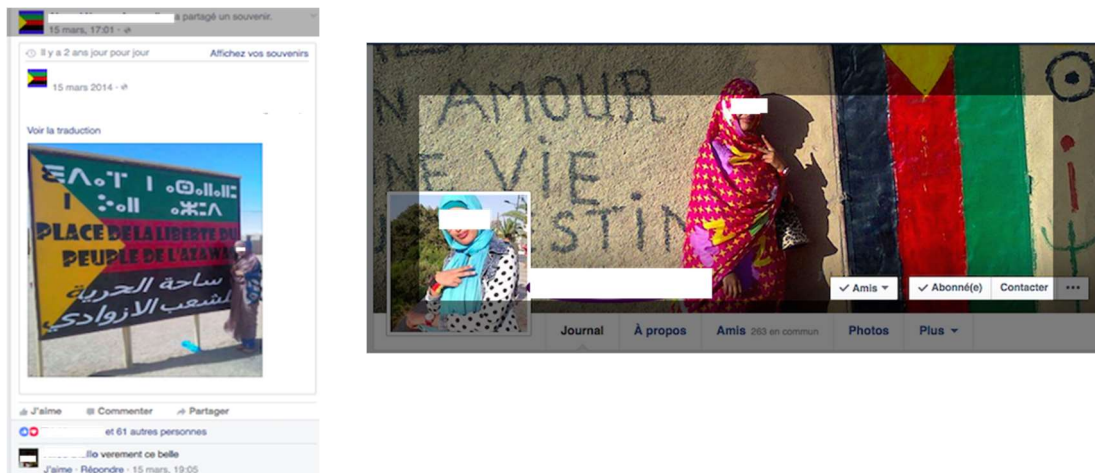
Fig. 1 L'intrication online / offline, de l'espace public au web