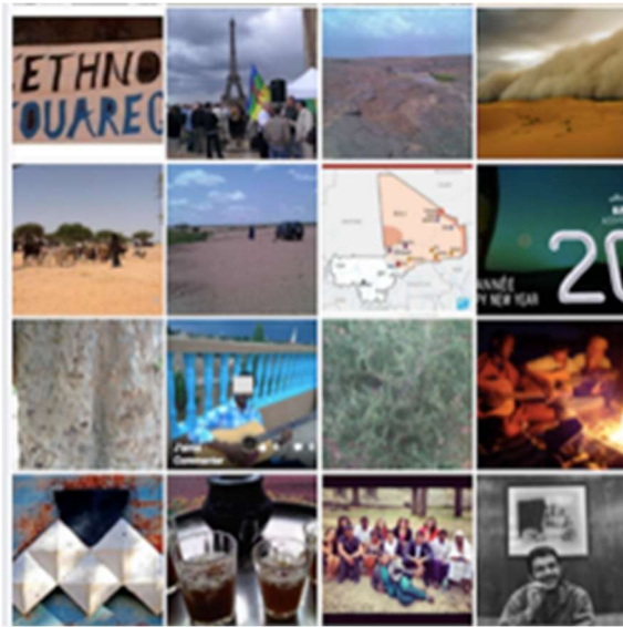
Fig. 3 Capture d'écran d'un album photo d'un usager de Facebook