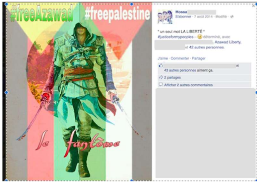
Fig. 2. Capture d'écran d'une publication associant les causes de l'Azawad et de la Palestine et le personnage principal du jeu vidéo Assassin's Creed (Ubi Soft).