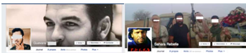
Fig. 4 Captures d'écran de publications Facebook