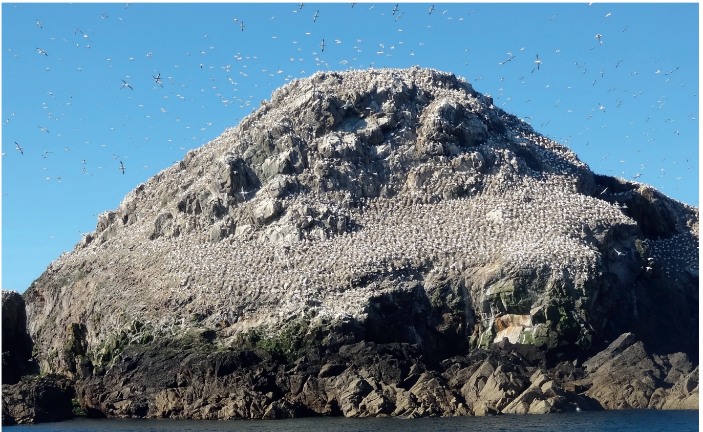
La Réserve ornithologique des Sept-Îles (Perros-Guirec) fut créée en 1912.