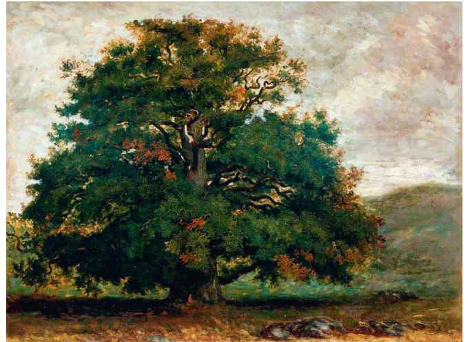
Arbre dans la forêt de Fontainebleau, par Théodore Rousseau (1812-1867), investi dans la protection de la forêt de Fontainebleau.

C'est ici qu'interviennent, de nouveau, les artistes. En effet, l'ancienneté des arbres de cette forêt et sa proximité de Paris en avaient fait un modèle pratiquement unique pour les peintres romantiques d'alors, et notamment ceux de l'« école de Barbizon ». Ces peintres jugent que les coupes de plus en