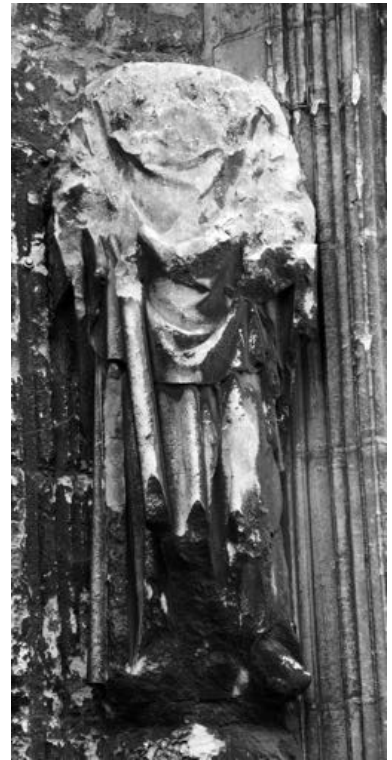
FIG. 9. Meaux, cathédrale Saint-Étienne, portail sud du transept, .