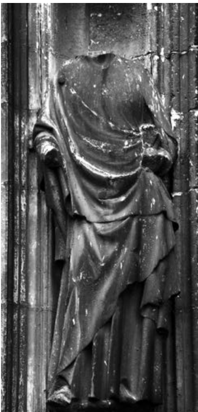
FIG. 8. Meaux, cathédrale Saint-Étienne, portail sud du transept, .