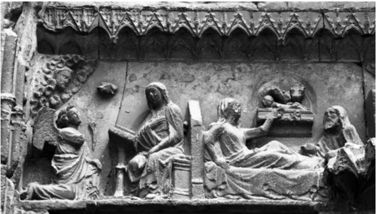
FIG. 22. Meaux, cathédrale Saint-Étienne, façade occidentale, portail sud, sainte Agathe.