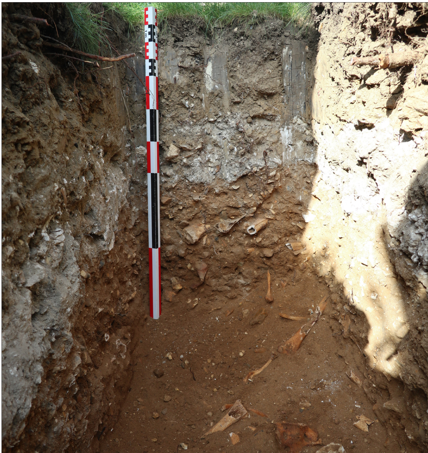
Figure 2 : vue des ossements humains dans la partie inférieure de la tranchée

La reconnaissance montre qu'il s'agit de restes démobolisés, sans connexions, et non de sépultures en place. Un tesson de pichet en grès du Beauvaisis du XVIe s. a été découvert dans la couche (identification : François Renel, Inrap).