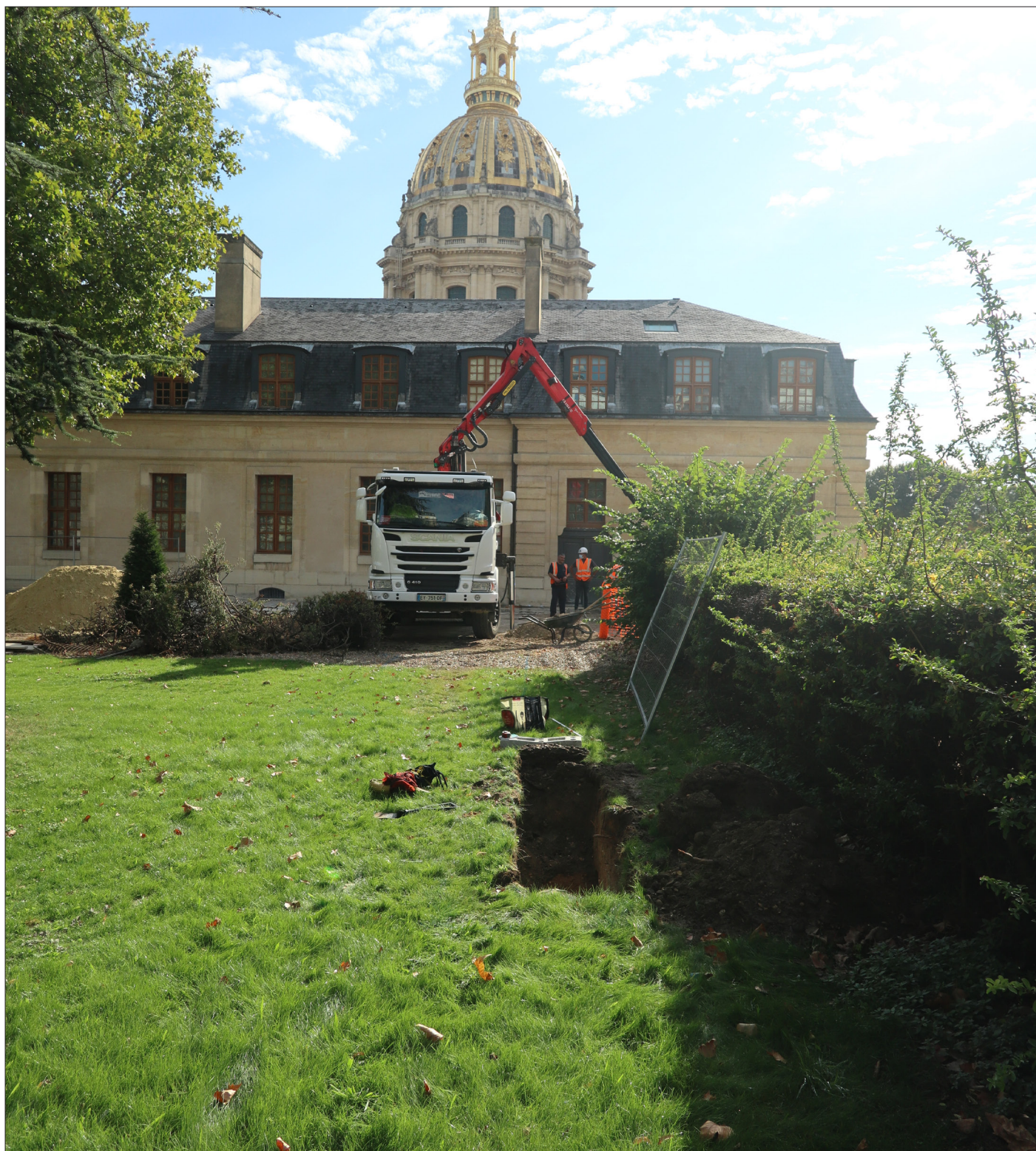
Figure 1 : tranchée de raccordement interrompue après la découverte des ossements humains