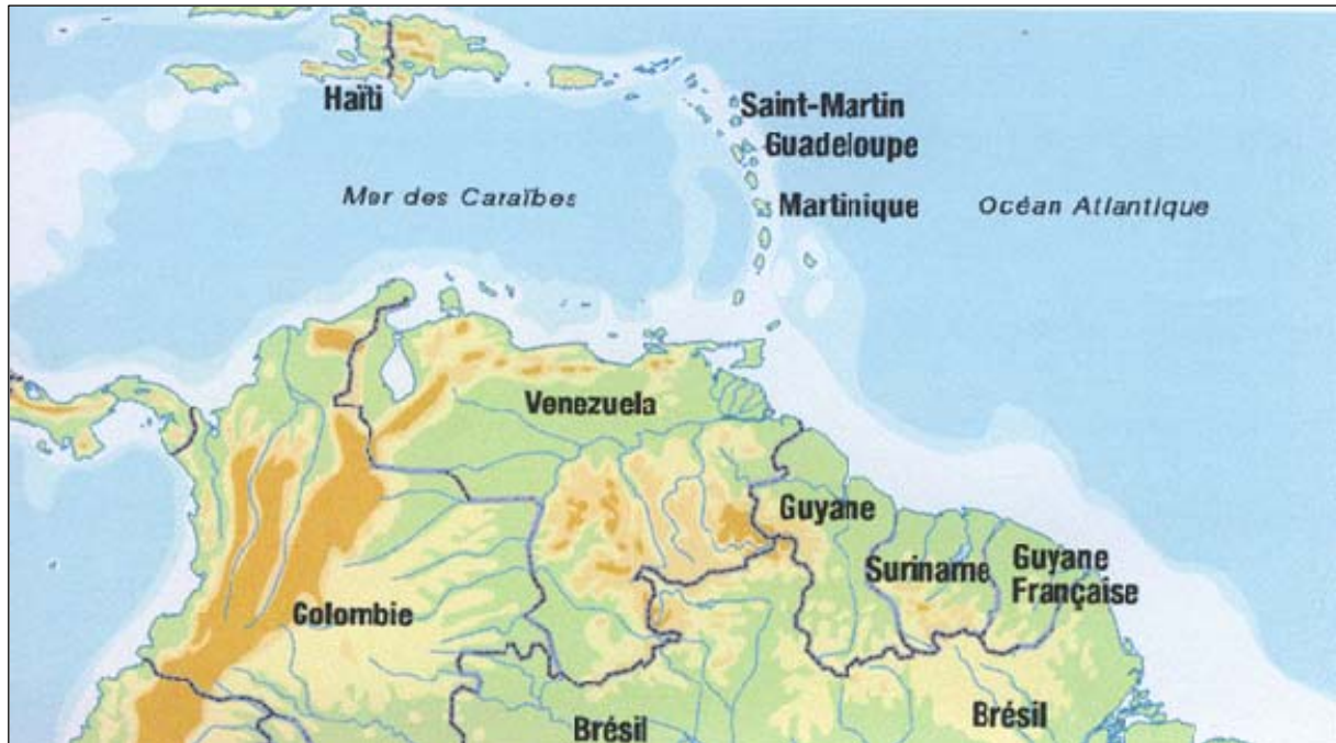
Figure 1 - Carte des quatre sites

Enfin, précisons que dans un souci d'anonymisation maximale des discours des professionnels rencontrés, certaines précisions n'ont été apportées que lorsque c'était pertinent au regard du propos, telles que la spécialité des médecins ou le lieu précis (Saint-Martin ou la Guyane, dans la partie qui traite simultanément des deux terrains).