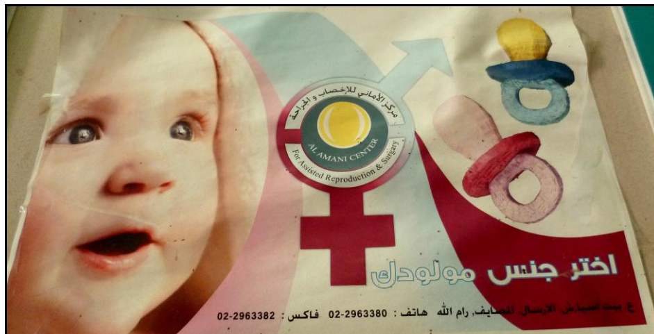
Figure 1 : panneau publicitaire des centres de procréation assistée, Ramallah, 2011

Source : photo prise par nos soins, « Choisis le sexe de ton enfant ! », Ramallah, Juin 2011