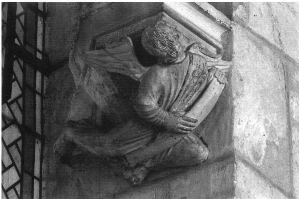
Fig. 5 Laon, cathédrale Notre-Dame. Culot provenant du chœur ancien, l'homme ailé .