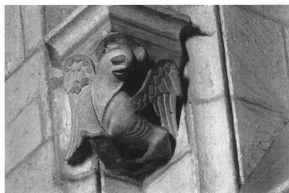
Fig. 6 Laon, cathédrale Notre-Dame. Culots provenant du chœur ancien, le lion et le bœuf .