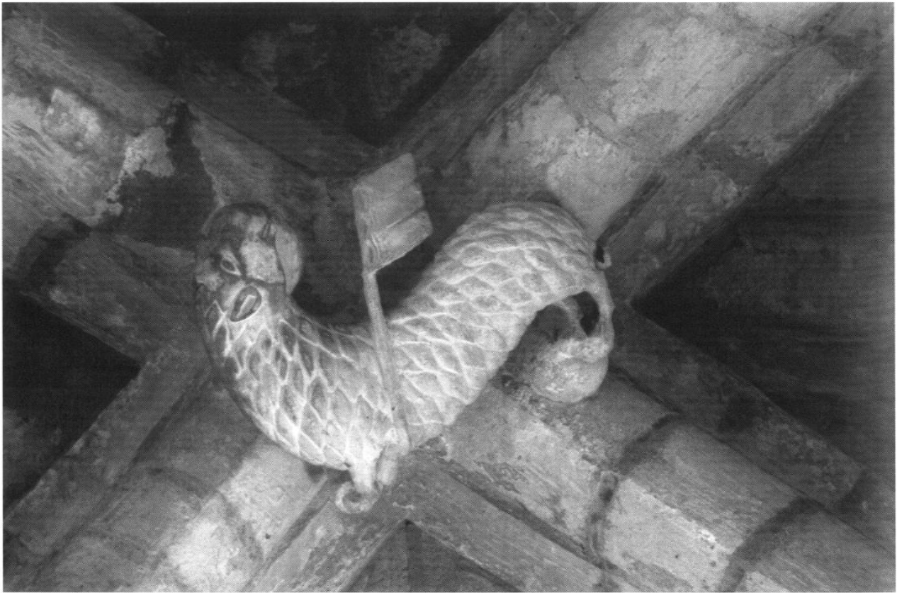
Fig. 3 Laon, cathédrale Notre-Dame. Clef de voûte provenant du chœur ancien, Agneau mystique .