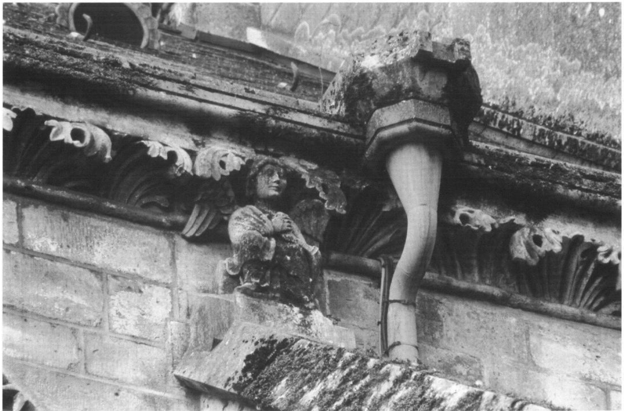
Fig. 2 Laon, cathédrale Notre-Dame. Chœur, flanc nord, travée I, ange de l'arc-boutant .

chées, utilisation du trépan pour percer des trous profonds entre les feuilles et accuser davantage les reliefs. Ce décor peut être observé actuellement dans les trois premières travées du chœur. Au-delà de la troisième travée au nord comme au sud, à l'endroit exactement où les travaux du nouveau chœur ont commencé, la corniche extérieure des tribunes change de motif : les feuilles d'acanthé sont abandonnées et remplacées par des entrelacs de rinceaux. En revanche, au-dessus des fenêtres hautes côté nord, la corniche ornée également de feuilles d'acanthé se poursuit jusqu'à la sixième travée du chœur en raison du remploi de fragments. Ces fragments proviennent probablement de la corniche du flanc sud des travées droites du chœur ancien, entièrement renouvelée et décorée de rinceaux au moment de la reconstruction du chœur au XIII e siècle. W. Clark a montré que toutes les fenêtres du chœur primitif ont été élargies au XIII e siècle, mais en reemployant des colonnettes et des claveaux 9 . Ainsi on observe, aujourd'hui, un décor en chevrons sur les archivoltes des fenêtres hautes orientales du transept et sur les fenêtres hautes des trois premières travées du chœur. À partir de la quatrième travée, les archivoltes des fenêtres hautes sont couvertes de fleurons.