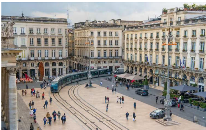
Vue sur la place de la Comédie et le célèbre bâtiment du Grand Théâtre de la ville de Bordeaux.

« prévision immédiate », c'est-à-dire de décrire un phénomène en train de se produire ou qui s'est produit tout récemment, car les bases de données du recensement imposent aux chercheurs et aux techniciens des collectivités territoriales un décalage des millésimes. Il faut donc d'autres sources.