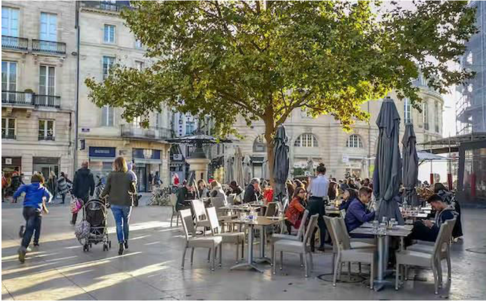
La rue Condillac dans le centre ville de Bordeaux.