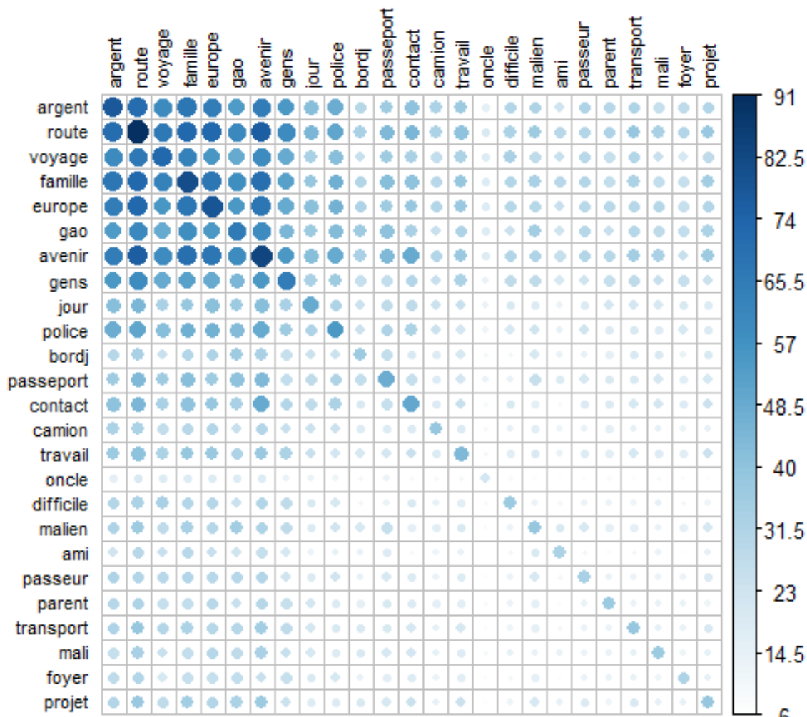
Figure 2. Matrice des 25 mots les plus fréquents dans les récits des mineurs

L'intensité de la couleur est proportionnelle à la force de la co-occurrence entre deux termes.