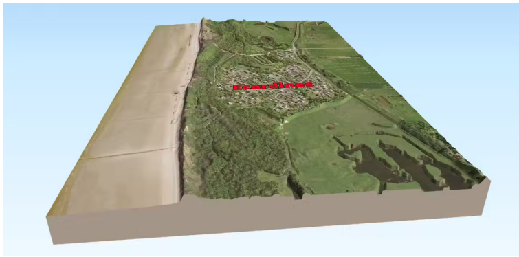
Lotissement des Ecardines.

Ces projets s'inscrivent dans une démarche participative et collaborative mise en place par l'équipe de chercheurs dont l'objectif était d'impliquer les habitants dans le devenir de leur littoral.