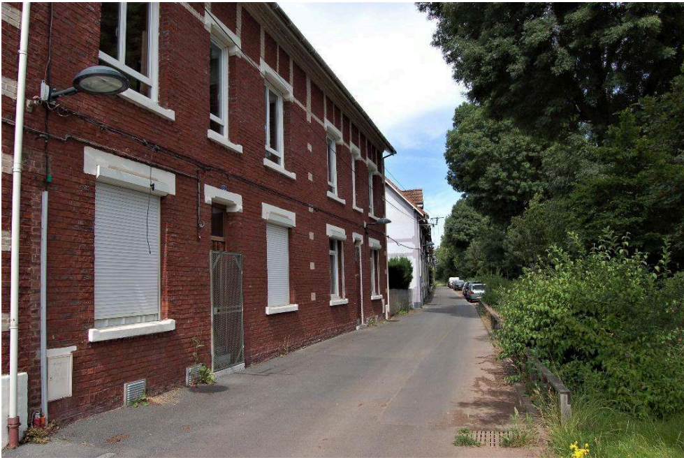
En haut à gauche : rue Taffin, Wallers-Arenberg (59) ; en haut à droite : la cité des Provinces, Lens (62). En bas à gauche : la cité Declercq, Oignies (62) ; en bas à droite : la rue Parmentier, Lens (62).