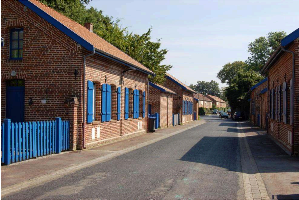
Figure 8. Vues sur les différentes cités minières étudiées