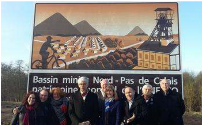
Figure 4. Inauguration du premier panneau sur l'A2, à hauteur de la commune de Crépin (59), le 20 novembre 2016

Source : Site internet de la préfecture régionale, 2017, consulté le 18 sept. 2018.