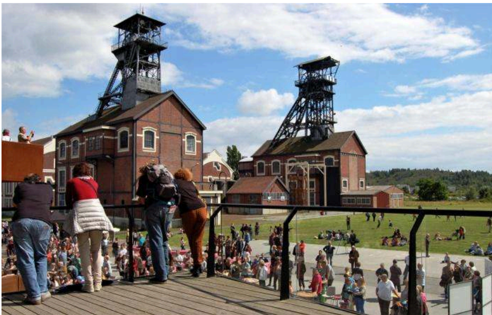
Figure 3. Événement des Rutilants sur le site du 9/9bis à Oignies (62)