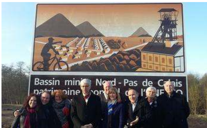
Figure 4. Inauguration du premier panneau sur l'A2, à hauteur de la commune de Crépin (59), le 20 novembre 2016