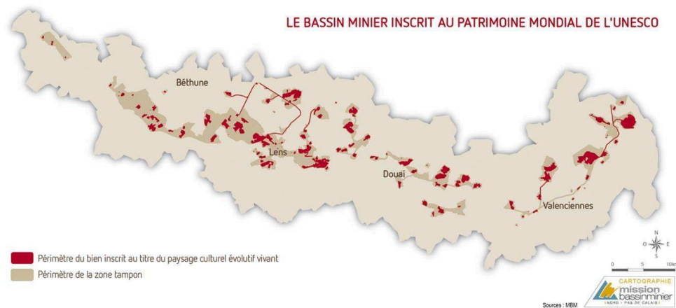
Figure 2. Périmètre de l'inscription Unesco