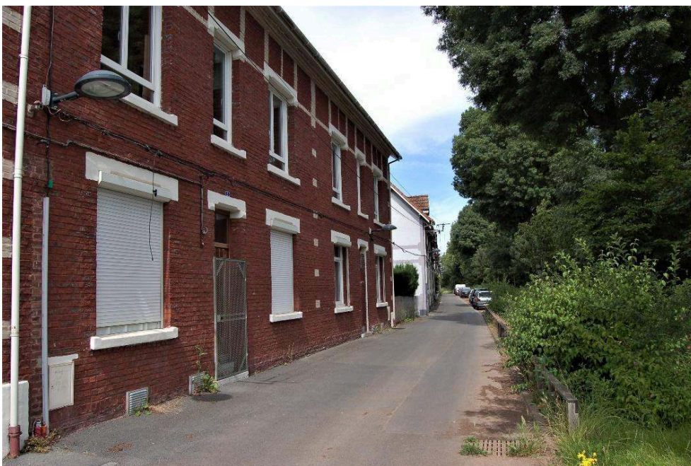
En haut à gauche : rue Taffin, Wallers-Arenberg (59) ; en haut à droite : la cité des Provinces, Lens (62). En bas à gauche : la cité Declercq, Oignies (62) ; en bas à droite : la rue Parmentier, Lens (62).