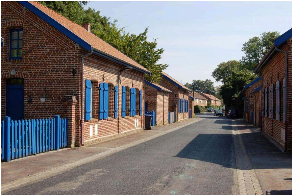
Figure 8. Vues sur les différentes cités minières étudiées