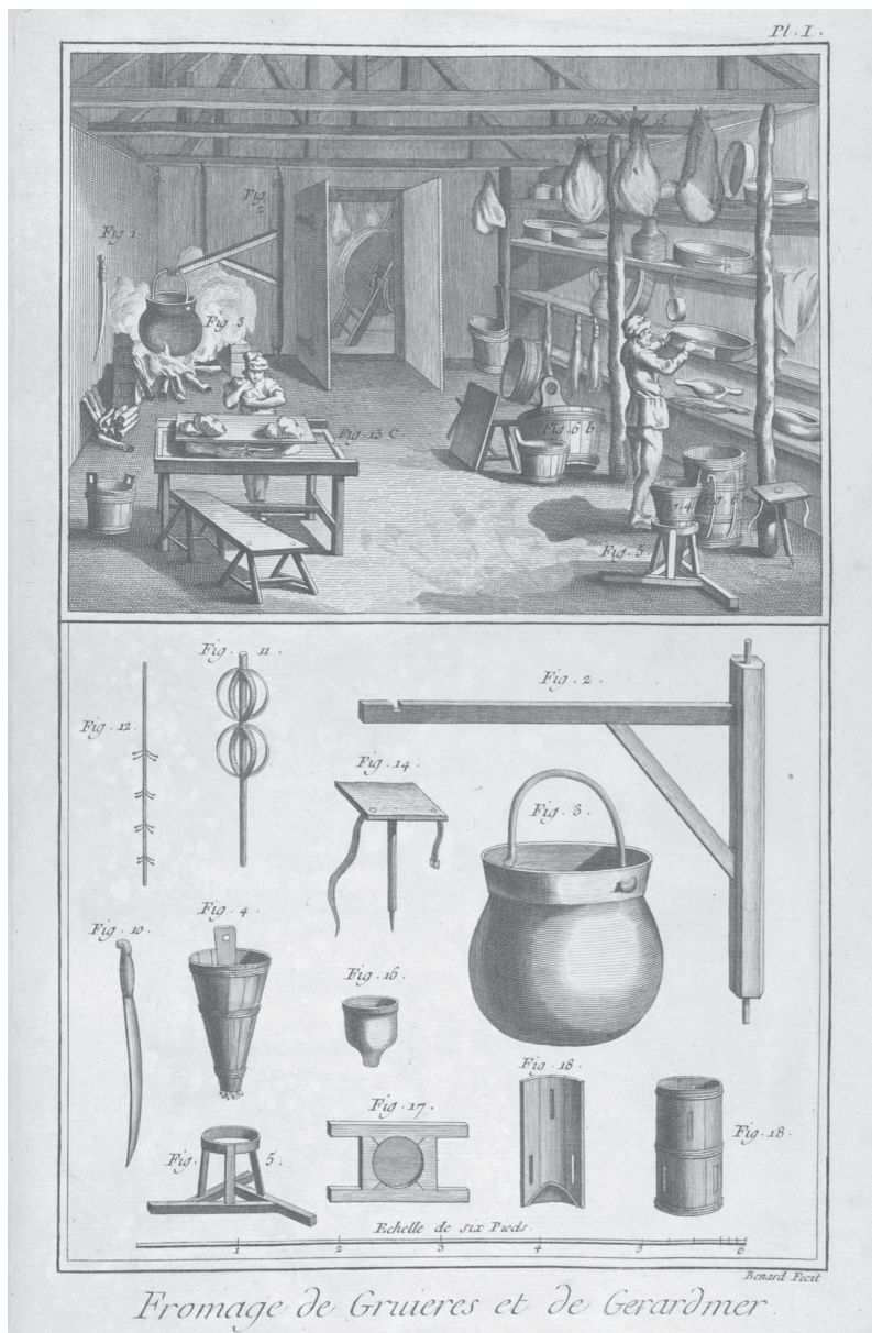
Fig. 2. Un esempio di tavola grafica doppia tratta dall'Encyclopédie, 1751.

compito di riaffermare questa idea di autenticità, muovendo dalla ricerca di una corrispondenza tra manufatto e repertorio a una corrispondenza tra manufatto e artigianato. Facendo ciò il manuale tornerebbe a esercitare una funzione epistemologica radicata nella forma enciclopedica dei Lumi. Proprio gli enciclopedisti ritennero infatti necessario correlare l' Encyclopédie ou Dictionnaire raisonné des sciences, des arts et des métiers (1751-1777) opera summa del sapere umano, con una serie di tavole grafiche divise orizzontalmente in due campi. A queste ultime