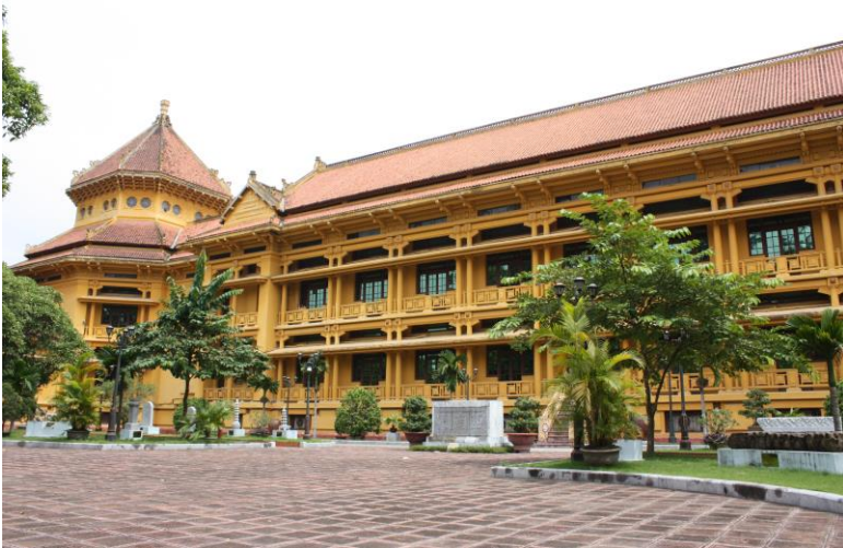
Fig. 2. Hanoï, le Musée national d'histoire vietnamienne (Hébrard, 1922) en style "méditerranéen asiatique" : une réminiscence adriatique.

l'architecture à l'Université polytechnique, jusqu'à l'arrivée d'un nouveau gouvernement avec lequel sa collaboration ne put être poursuivie. Entre-temps, Hébrard eut la charge à partir de 1922, en tant qu'architecte en Indochine, de construire notamment le siège de l'École française d'Extrême-Orient (EFEO), qui évoque sur sa façade le rythme antique du palais de Dioclétien. Le bâtiment, devenu en 1958 le Musée national d'histoire vietnamienne, est emblématique de cette architecture éclectique française en Indochine définie par l'homme de lettres vietnamien Nguyen Manh Tuong (1909-1997) comme « méditerranéen asiatique ». Cette période de son travail apparaît comme un temps d'intense création, à la recherche de fait d'une synthèse architecturale entre Orient et Occident, d'un syncrétisme urbain qui a laissé sa trace dans la trame urbaine de Hanoï. À cet égard, Hébrard semble avoir retenu et appliqué dans le contexte colonial français les leçons de l'urbanisation antique de la Dalmatie qu'il avait étudiée avant et durant la guerre.