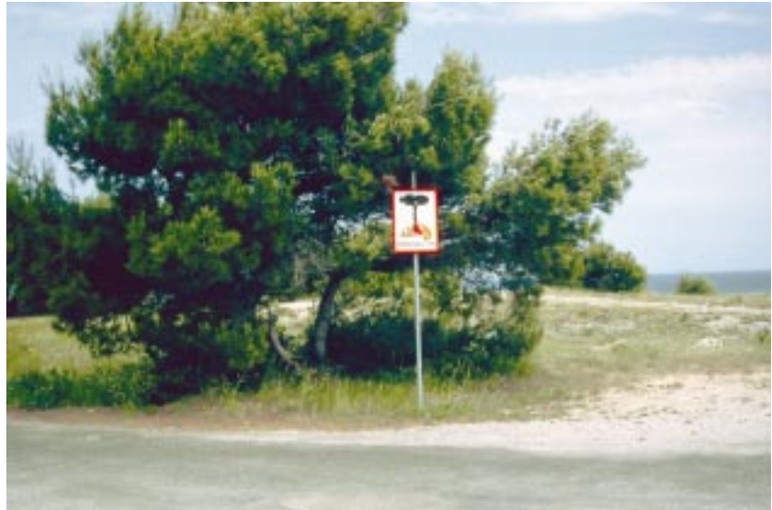
Fig. 4 Die Biomasseakkumulation im Mittelmeerraum gefährdet die Biodiversität und erhöht die Waldbrandrisiken. Pinus halepensis auf dem Cap Leucate Biomass accumulation endangers biodiversity and increases the risk of forest fires. Pinus halepensis at Cap Leucate

Gleichwohl gibt es auch heute noch abweichende Meinungen. Widersprüchliche Beurteilungen der ökologischen Wertigkeit von Feuer fasst NUTZ (2000) unter dem plakativen Satz „Die ‚duale Rolle‘ des Feuers“