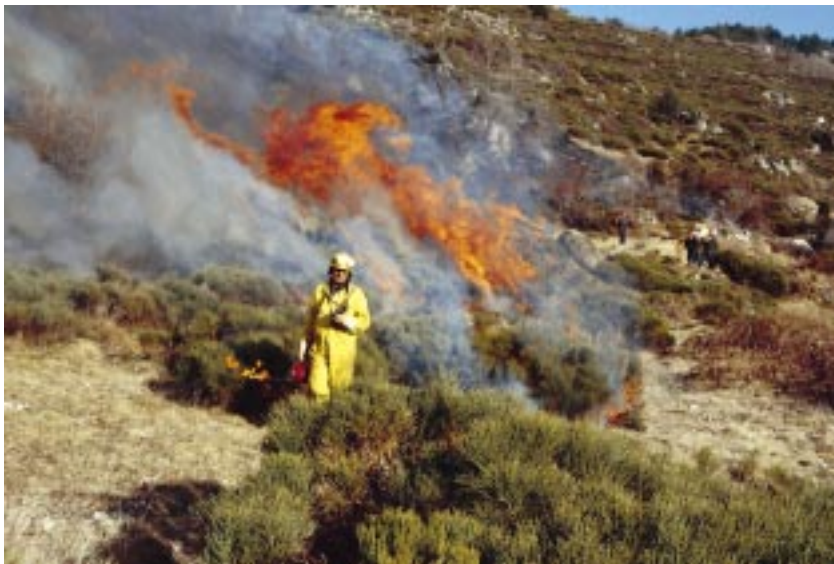
Fig. 10 Einsatz von Feuer zur Landschaftspflege in den Pyrenäen – Genista-purgans -Heiden Fire as a tool of landscape management in the Pyrenees – Genista purgans -heathland