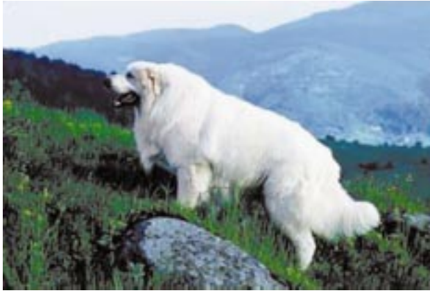
Fig. 8 Der Patou, eine in Vergessenheit geratene Schutzhundrasse, gewinnt durch die Wolfsproblematik wieder an Bedeutung.

The "Patou", a race of dog bred for sheep protection already on the verge of extinction, has regained importance with the reappearance of wolves.