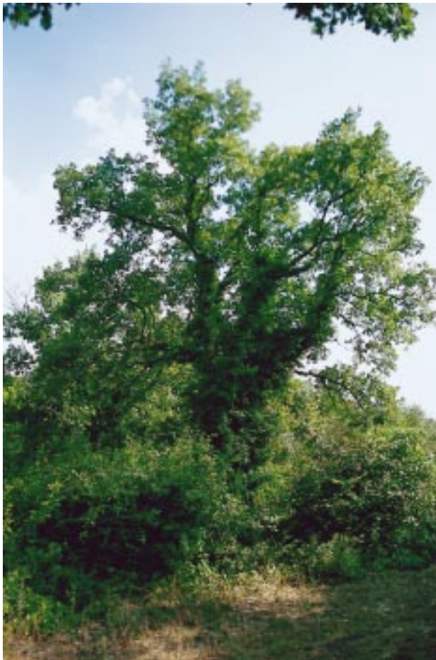
Fig. 3 Die Flaumeiche ( Quercus pubescens ) nimmt inzwischen eine wichtige Stellung in mediterranen Ökosystemen ein. Beispiel aus der Vaunage südwestlich von Nîmes Quercus pubescens has grown in importance in Mediterranean-type ecosystems. Example from the Vaunage, southwest of Nîmes

Einzel Fall ist. Allerdings konnte EICHBERGER (1999) in Italien Ausbreitungsprozesse der als thermophil geltenden Euphorbia dendroides beobachten. Großräumig lässt sich vielmehr ein schleichender Prozess des Eindringens von Waldbäumen wie des schon angesprochenen sommergrünen Quercus pubescens (Fig. 3; BOHR 1997, BONIN & ROMANE 1996, MARTIN et al. 1997, NEFF & FRANKENBERG 1995, ROMANE 1995) sowie von Koniferen wie Pinus halepensis oder Pinus pinea beobachten (FRANKENBERG et al. 1996, NEFF & FRANKENBERG 1995 a). Waldtierarten wie Bussard ( Buteo buteo ), Wespenbussard ( Pernis apivorus ), Schwarzspecht ( Dryocopus martius ), Sumpfmöwe ( Parus palustris ) und Singdrossel ( Turdus philomelos ) – Arten, die bis vor kurzem für weite Teile des mediterranen Südfrankreichs als ausgestorben galten (BLONDEL & ARONSON 1999, S. 250) – profitieren ebenfalls von diesen Prozessen. Die Verbuschung bzw. Verwaldung führt zu einer Verdrängung von vielen Pflanzen und Tierarten, die ein offenes Habitat, wie z. B. in typischen Maquis oder Garriguesökosystemen, benötigen, zugunsten von wenigen Waldarten (BLONDEL & ARONSON 1999).