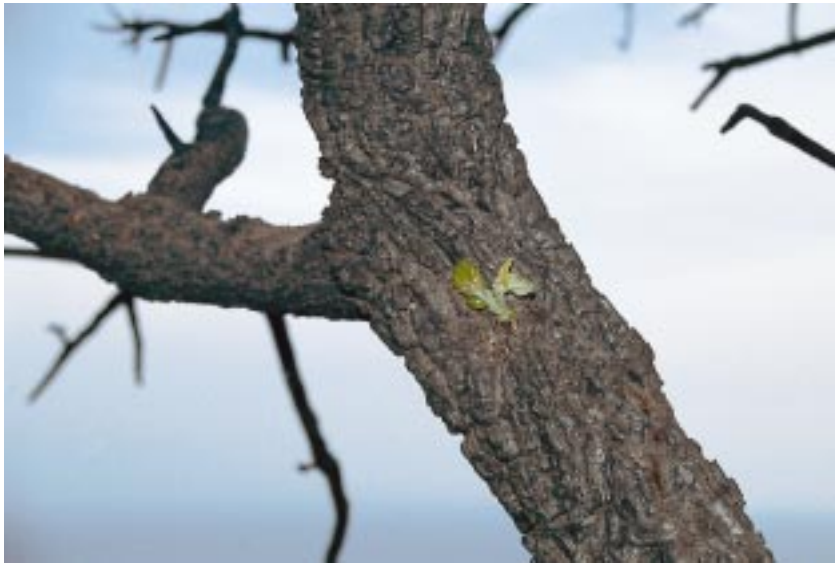
Fig. 6 Banyuls: Geschützt durch den isolierenden Kork, treibt die Korkeiche ( Quercus suber ) schon zwei Monate nach einem Waldbrand aus (Foto: NEFF, Oktober 1995). Banyuls: Protected by insulating cork, Quercus suber is growing new shoots only two months after a forest fire (Photo: NEFF, October 1995).

wird, außerdem durch an das Feuer angepasste Vermehrungsmechanismen. Unterschieden werden „Resprouter“ und „Reseeder“. Die sich durch Stockausschlag (engl.: resprout) regenerierenden Steineichen ( Quercus ilex ) und Kermeseichen ( Quercus cociferra ) sind Resprouter. Cistus monspeliensis und Cistus albidus sind Reseeder, ihre Samen werden u. a. durch die Wärme der Feuer stimuliert (vgl. u. a. TRABAUD 2000b). Die Diasporenbank (TRABAUD 2000b) und überlebende Übersteher und Pflanzengruppen (NEFF 2000) spielen eine besondere