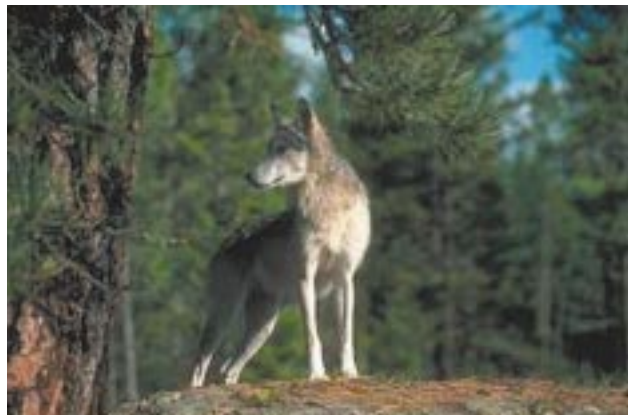
Fig. 7 Die Wölfe stellen für den französischen Naturschutz eine große Herausforderung dar. Wolves are great challenge for French nature conservation.

Zwei Hauptgründe sind zu nennen. Zum einen hat sich die Viehhaltung in den letzten 60 Jahren entscheidend geändert – einem Zeitraum, in dem es kaum noch