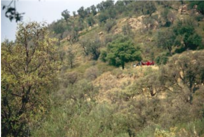
Fig. 5 Sechs Jahre nach dem großen Waldbrand von Collobrières hat sich die Vegetation auf dem besonders schwer mitgenommen Col de Babaou wieder regeneriert ( Quercus suber , Quercus pubescens , Castanea sativa ; Foto: NEFF, Juni 1996). Six years after the large forest fire of Collobrières the vegetation of the particularly damaged Col de Babaou sector has regenerated ( Quercus suber , Quercus pubescens , Castanea sativa ; Photo: NEFF, June 1996).